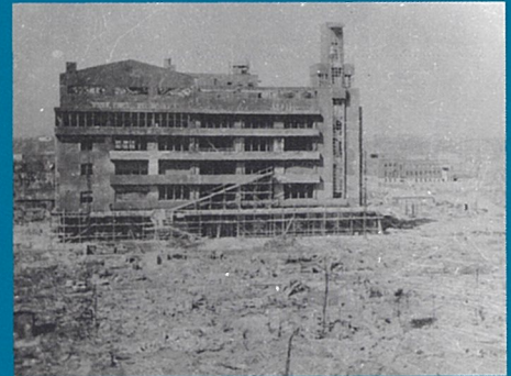
焼野原に建つ天満屋本店 1945年(昭和20)10月