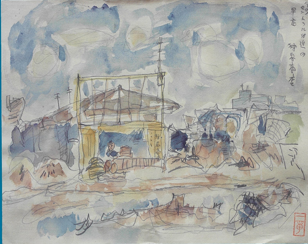
「セントラル付近の早店」1945年(昭和20)11月 佐藤一章 作 岡山市立中央図書館所蔵・画像提供