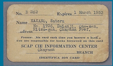
戦後岡山に作られたCIE図書館の貸出カード