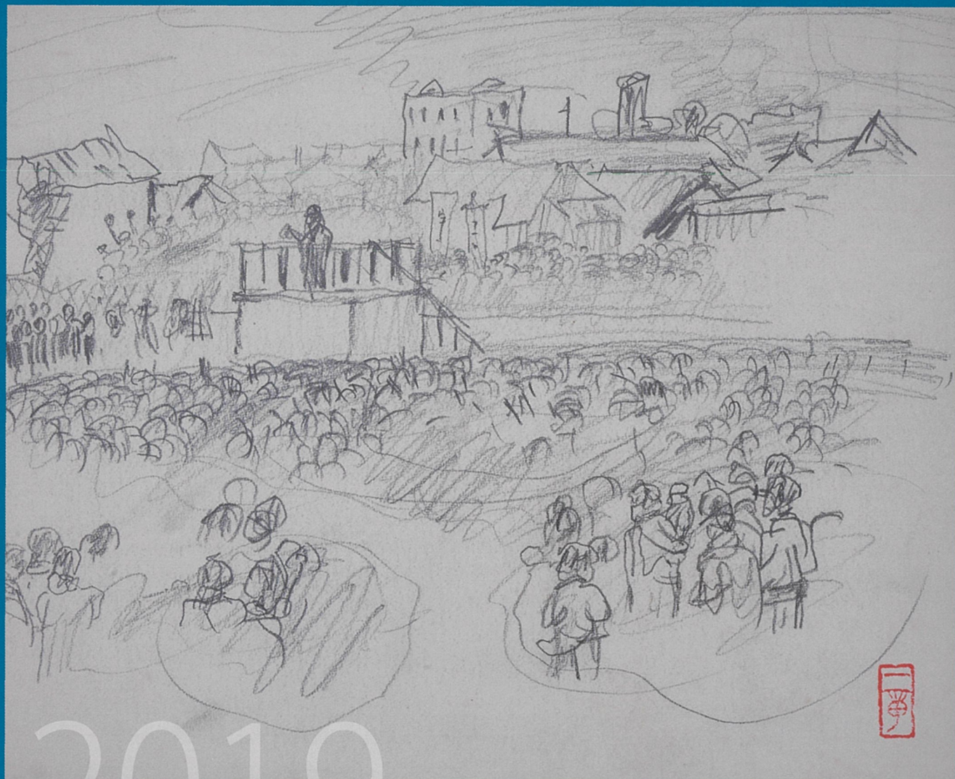
戦災都市岡山に行幸した昭和天皇を歓迎場に迎える人々 1947年(昭和22)12月9日 佐藤一章 作