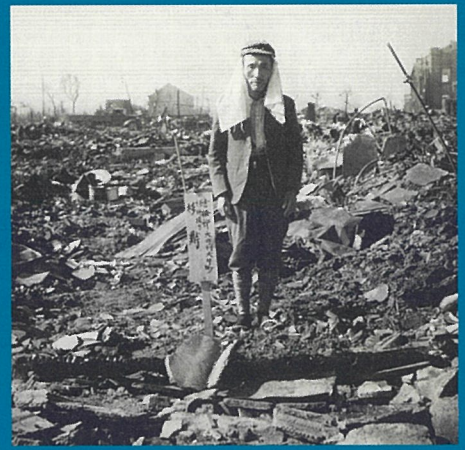
自宅の焼跡に立つ男性 1945年(昭和20)

1948年(昭和23)ごろまでに岡山市の復興都市計画の基本構想が検討され、またこの年初めて地方開催として、岡山に誘致された日展には23万人もの人が押しかけたと言われます。こうした美術展を始め、様々な文化活動も活発に行われました。終戦直後から始まった岡山の人々の動きをご紹介します。