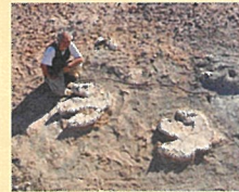
タルボサウルス(全身復元骨格) 岡山理科大学