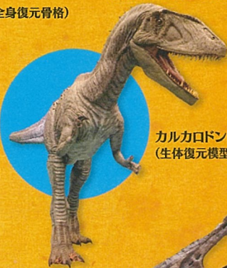
カルカロドントサウルス(生体復元模型)

三畳紀に続くジュラ紀は大型化した植物食恐竜が出現し、「恐竜巨大化の時代」を迎えます。全長27mにもなるディプロドクスのほか、アロサウルスやステゴサウルスなど後期ジュラ紀の北アメリカを代表する恐竜が登場します。