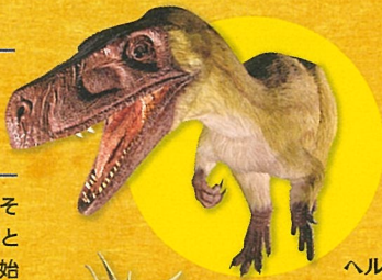
ヘルレサウルス(生体復元模型)

「恐竜時代」のはじまりはおよそ2億3000万年前、中生代三畳紀と呼ばれる時代です。ここでは、原始的な恐竜ヘルレサウルスやココエロフィシスなど、恐竜の発祥地といわれる南アメリカなどの「最古の恐竜たち」を紹介します。