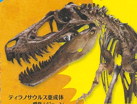
ティラノサウルス亜成体 愛称:ジェーン (全身復元骨格)

最後の恐竜時代・白亜紀には大陸間の分断が進み、恐竜たちはそれぞれの地域で独自に多様化します。本コーナーでは、アメリカ・モンタナ州で発見されたティラノサウルス亜成体(愛称:ジェーン)の全身復元骨格やロボットを岡山初公開します。