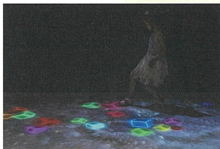
《Cosmic Square》坪倉輝明 ©teruaki TSUBOKURA