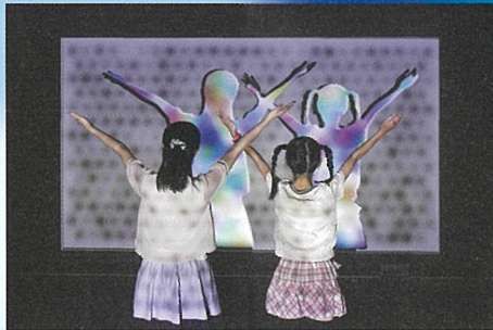
《Shadow+》徳井太郎 / 清水雄大 ©taro TOKUI / yudai SHIMIZU