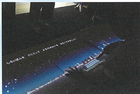
《よるにおもう》重田佑介 + Zennyann ©yusuke SHIGETA + Zennyann