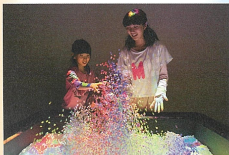
《SplashDisplay》的場やすし / 山野真吾 / 徳井太郎 ©yasushi MATOBA / shingo YAMANO / taro TOKUI 協力：電気通信大学小池研究室