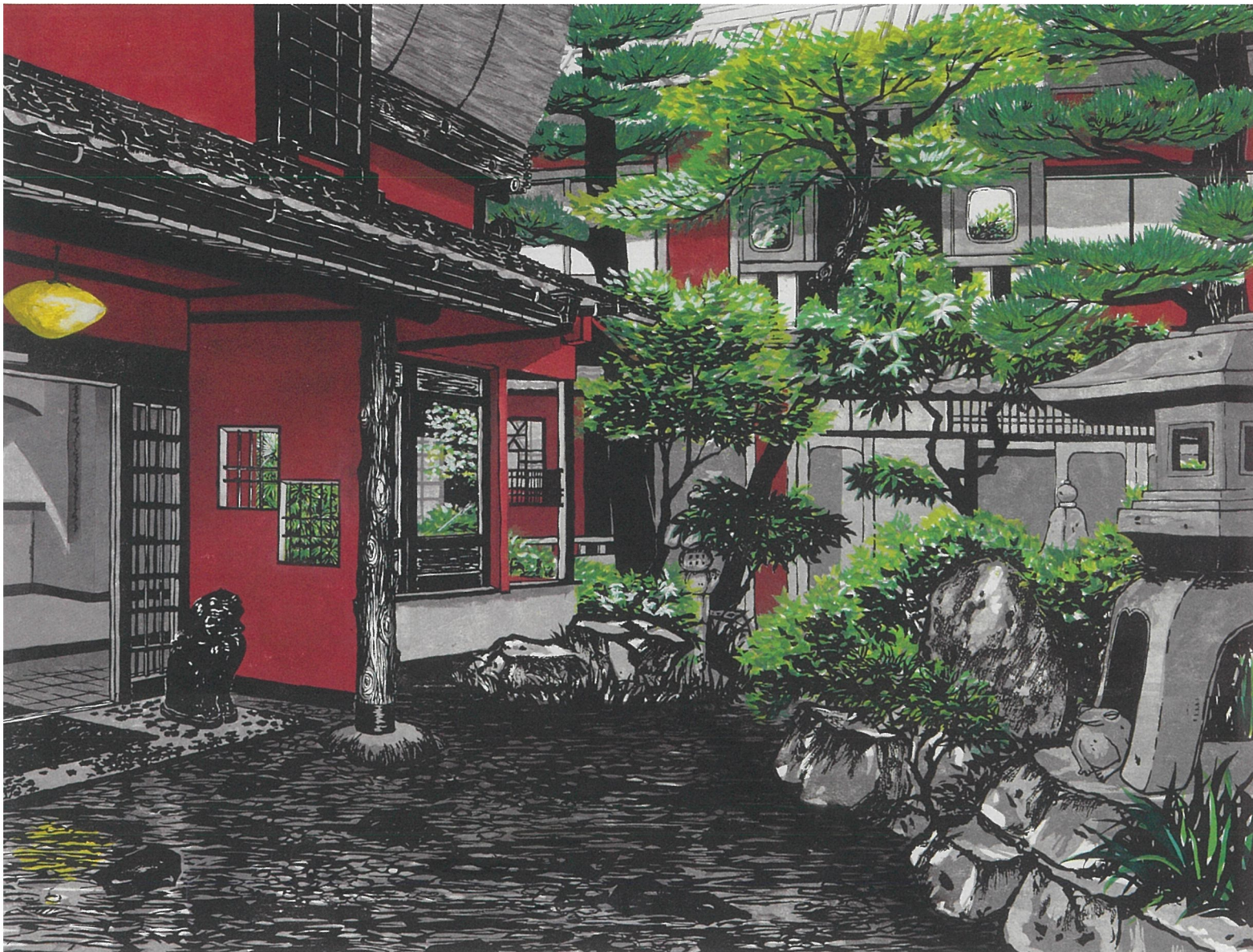
「紅樓依綠」2005年(第37回日展特選) ©HEEMORY/STEPeast