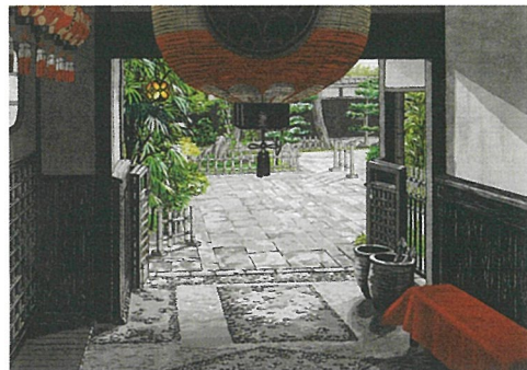
「華燈翠園」2011年 第43回日展入選