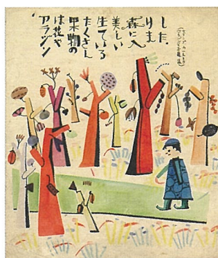
『アラジン』1940～43年？ (※) 展示替え対象作品