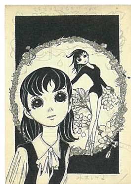
『ママと呼ばなかったけれど』1960年頃 (未完成・未発表作品)