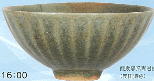
龍泉窯系青磁碗 (鹿田遺跡)