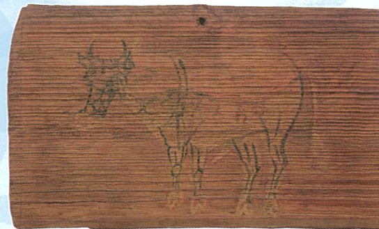
牛の絵馬(鹿田遺跡)