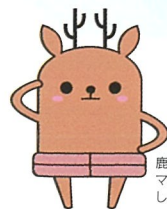
鹿田遺跡 マスコットキャラクター しかたん