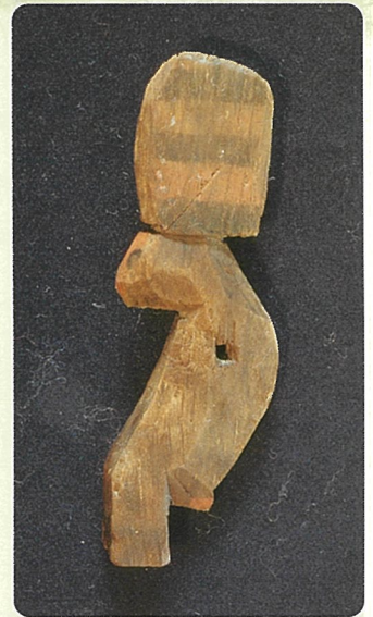
猿形木製品(鹿田遺跡)