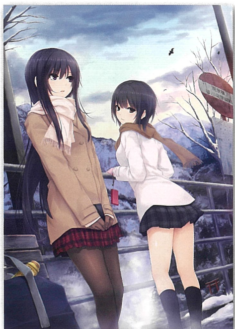
珈琲貴族(冬のバス停と少女達)

近年、日本発の漫画やアニメ、ゲーム、ライトノベルの挿絵など日本のポップカルチャーが世界から注目を浴びています。日本での評価もまた見直されるようになり、海外ではこうした文化を通じて日本を知る若者も増えています。