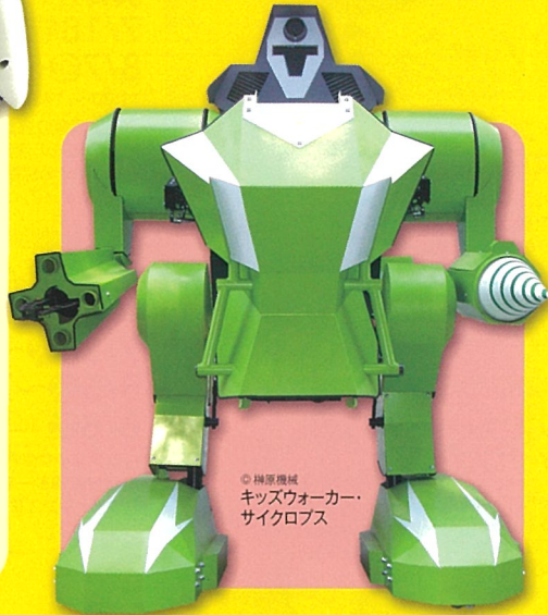
キッズウォーカー サイクロパス