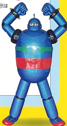
鉄人28号 © 2012 AIT

*鉄人28号の展示は会期中毎日 鉄人28号をいつか本場に飛ばそう! 日々研究を重ねる愛知工業大学の「鉄人プロジェクト」高さ2m重さ200キロの大型鉄人11号くんが、人の動作をまねて腕をあげたりするよ。