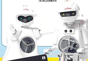
ムラタセイコちゃん © ムラタセイサク君 ©

ムラタセイサク君とムラタセイコちゃんが自転車や一輪車に乗って驚きのパフォーマンスを見せてくれるよ!