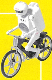
ムラタセイサク君 ©(株)岡山村田製作所

入場料 一般…1,100円 小・中・高校生…600円 3歳~小学生未満…300円 (3歳未満無料)