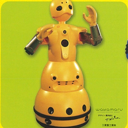
wakamaru ワカマル 三友堂工業株式会社