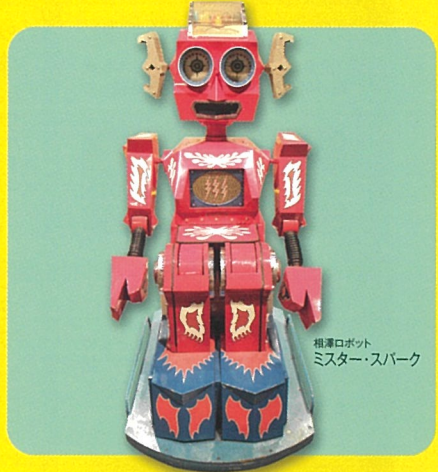
相澤ロボット ミスター・スパーク