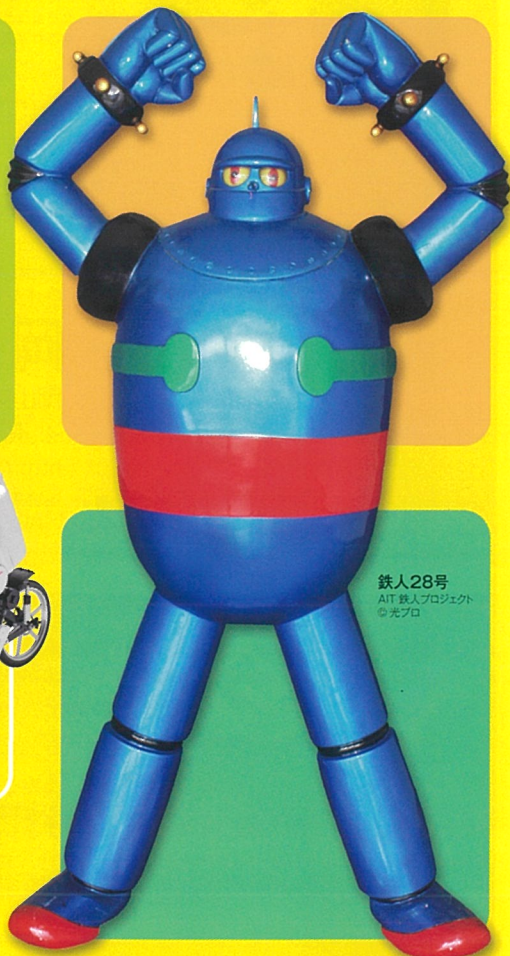
鉄人28号 AIT 鉄人プロジェクト ©光プロ