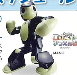
ロボットゆうえんち MANOI

7/18(土)~8/31(日) (8/22、23はお休み) 11:30~、14:30~、16:30~ ロボットゆうえんちによるロボットショー。“かわいくてたまらない!”まるで命があるかのような、パワフルで軽快なダンス。岡山ならではのMANOI君からのメッセージもお楽しみに!