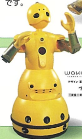
wakamaru 株式会社 日本ロボット工業

wakamaruは人とともに暮らすために開発されたロボットです。目と目を合わせて自然な距離で音声によるコミュニケーションができます。話したり、握手したり、じゃんけんしたり、一緒に遊んでくれるよ。