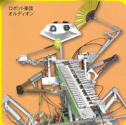
ロボット楽団 オルディオン