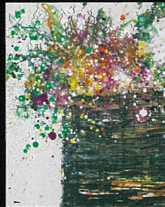
Flowers / 2013年