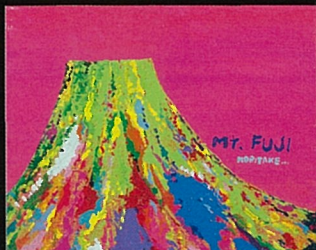
Mt. FUJI / 1996年