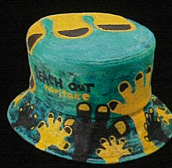
REACH OUT HAT / 2007年