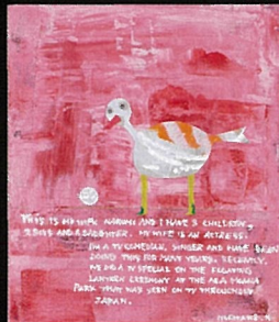
timing—タイミング / 2013年