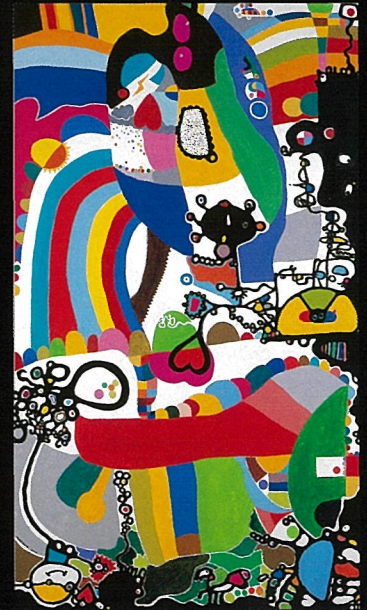
RAINBOW STATION / 2008年