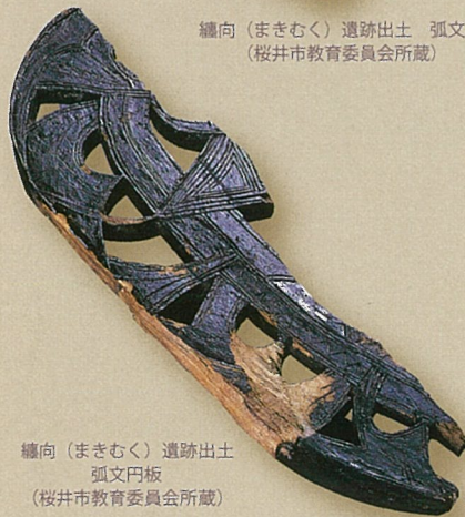
纏向（まきむく）遺跡出土 弧文円板 （桜井市教育委員会所蔵）