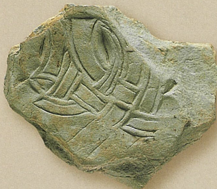
纏向（まきむく）遺跡出土 弧文石 （桜井市教育委員会所蔵）