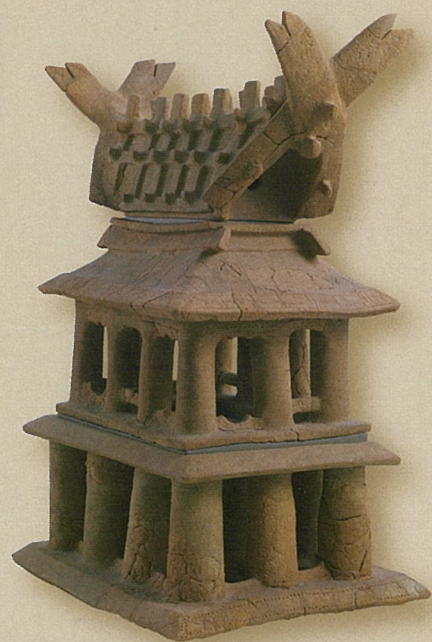
今城塚古墳出土 家形埴輪 （高槻市教育委員会所蔵）