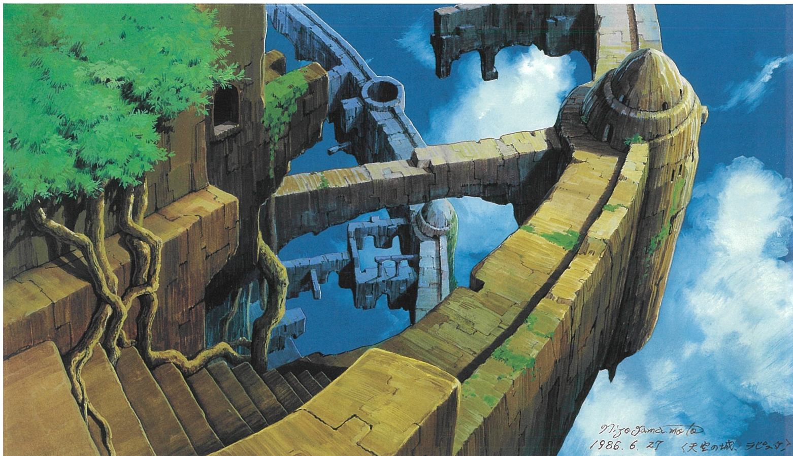
天空の城ラピュタ(荒廃したラピュタ) 1986年 ©1986二馬力-G ©山本二三