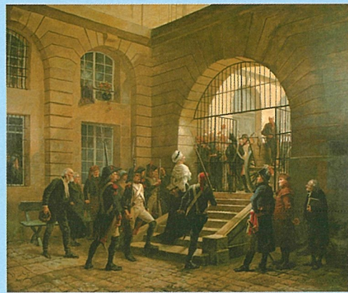
ジョルジュ・カン《コンシェルジュリを出るマリー・アントワネット》 1885年 油彩、カンヴァス 176×212cm カルナヴァレ博物館蔵