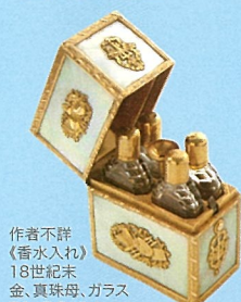
作者不詳 《香水入れ》 18世紀末 金、真珠母、ガラス 7.1×5.5×3.4cm ナポレオン財団蔵