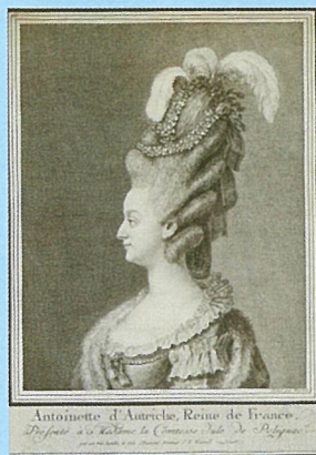
I.F.ヴァルテル《王妃マリー・アントワネット》 18世紀末 エッチングとビュラン 22.3×17.8cm カルナヴァレ博物館蔵