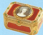
ジャン＝ジョゼフ・パリエール 《マリー・アントワネットの肖像画で装飾された小物入れ》 1774年 金、七宝 5.7×8×3.7cm ナポレオン財団蔵