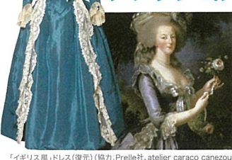
「イギリス風」ドレス(複製) (協力:Prelle社, atelier caraco canezou)

アントワネットが着ていたドレスを、肖像画や衣裳日誌などの史料をもとに、今回ブルボン王朝時代からつくろった老舗テーラーの協力により特別に再現！アンティークの布やレースを使った宮廷礼服、舞踏服、部屋着など、あこがれの衣装計5着を展示します。