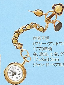
作者不詳 《マリー・アントワネットの時計》 1770年頃 金、琥珀、七宝、ダイヤモンド、真珠 17×3×0.2cm ジャン・ド・ベアルヌ伯爵蔵