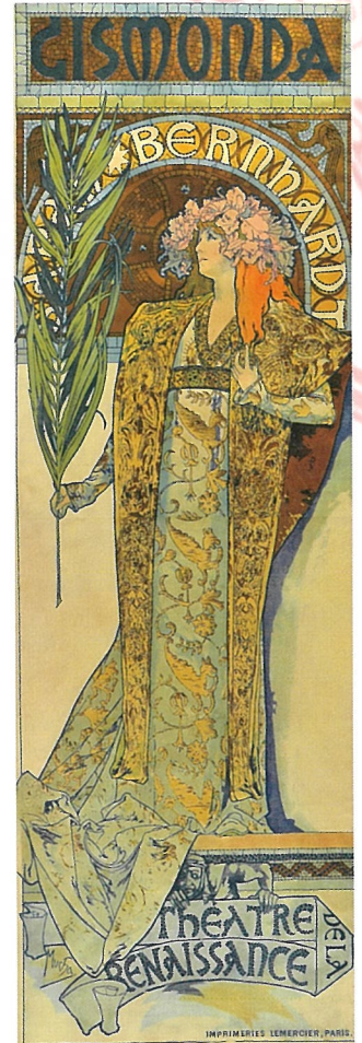
《ジスモンダ》1894年 リトグラフ/ポスター

本展では、日本初公開となるチェコの個人コレクションを中心に、油彩、水彩、デッサン類などの日本初公開作品をはじめ、代表的なポスター、版画など合わせて約160点を紹介。これまでのミュシャエッセンスに加え、新たなミュシャ芸術をご堪能ください。