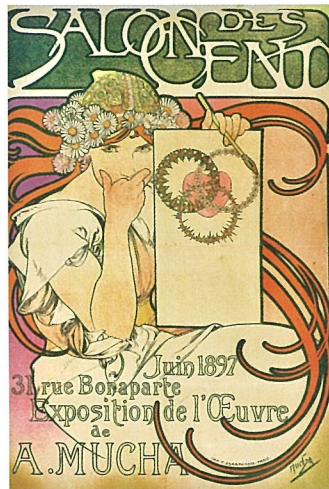
《サロン・デ・サン アルフォンス・ミュシャ展》1897年 リトグラフ/ポスター