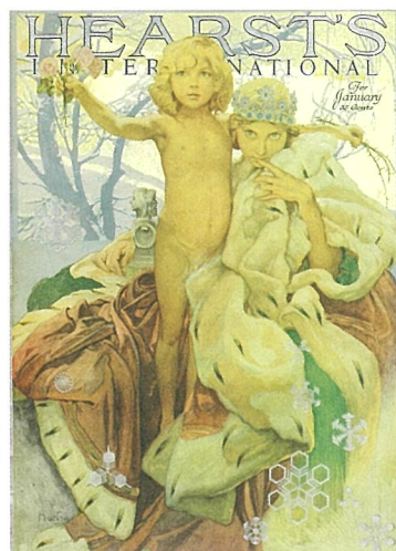
《「ハースツ・インターナショナル」誌》1922年 リトグラフ/表紙