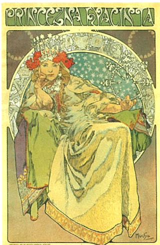
《ヒヤシンス姫》1911年 リトグラフ/冊子挿絵