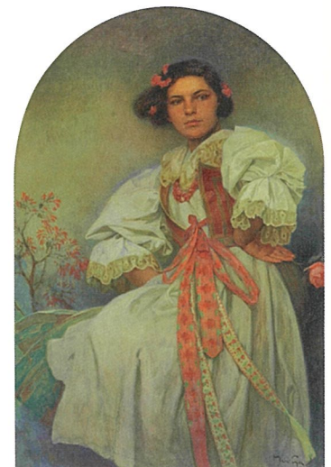
《エリシュカ》1932年 油彩、キャンバス/絵画