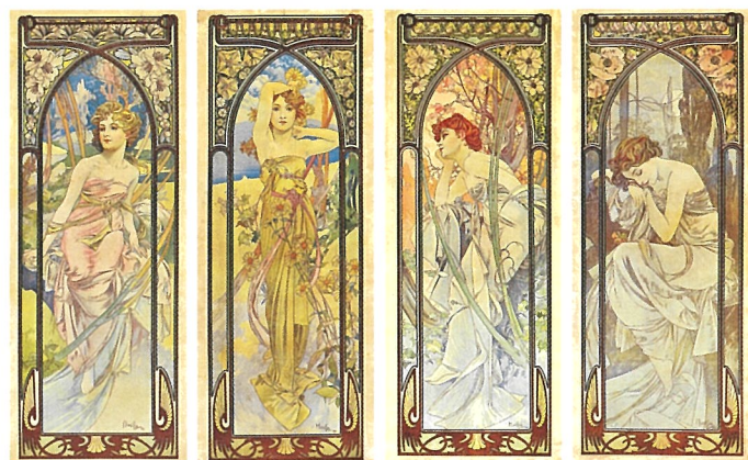
《一日の四つの時、朝の目覚め、昼の輝き、夕の夢想、夜の安らぎ》1899年 リトグラフ/装飾パネル