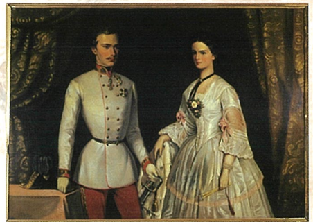
「エリザベトとフランツ・ヨーゼフ」油彩 ハート・イシュル市立博物館蔵