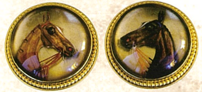
「馬のカフスポタン」 個人蔵