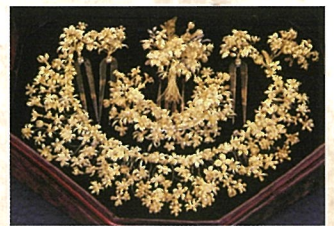
「花嫁衣裳の装飾品」 アルトエッティング司教行政府宝物館蔵