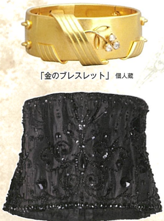
「金のプレスレット」 個人蔵