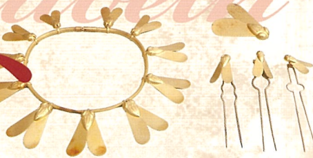
「ハエ」のネックレス・ピン 個人蔵