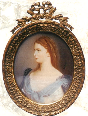
「エリザベトの円形牌」 個人蔵