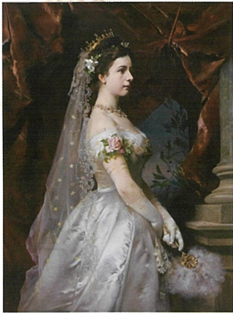
「羽の扇を持つエリザベト」 クロイスターノイブルク修道院博物館蔵

19世紀末のヨーロッパ世界の大革命の中、数奇な運命に翻弄された絶世の美女、オーストリア皇妃エリザベト(1837-1898)。「シシィ」の愛称で国民から親しまれ、わずか16歳にしてヨーロッパ王家の名門ハプスブルク家の皇帝フランツ・ヨーゼフ1世に嫁ぐものの、旧態依然とした宮廷生活にはなじみず現実から逃避し、生涯自らの美と自由を追い続け、贅の限りを尽くした生活を送りました。一方では、国家のあり方としての共和制に関心を寄せ、ハンガリーの建国にも尽力しました。しかし晩年には、宮廷を離れた孤独な旅の果てに、テロリストの暗殺による悲劇的な最期を遂げました。今回の展覧会では、身長172cm・体重50kg・ウエスト50cmという驚異のプロポーションを維持したコルセットや、花嫁エリザベトの頭を飾った黄金のティアラなど、ハプスブルク家をはじめヨーロッパ各地の美術館や個人が秘蔵する遺品から、絵画・装飾品・工芸品など、多くの日本初公開を含む約120点を一堂に展示します。中でも「星の髪飾り」は、エリザベトが実際に身につけていた伝説の逸品として、日本で初めて公開されます。今もなお高い人気を誇るエリザベトの華麗なる世界をご堪能ください。