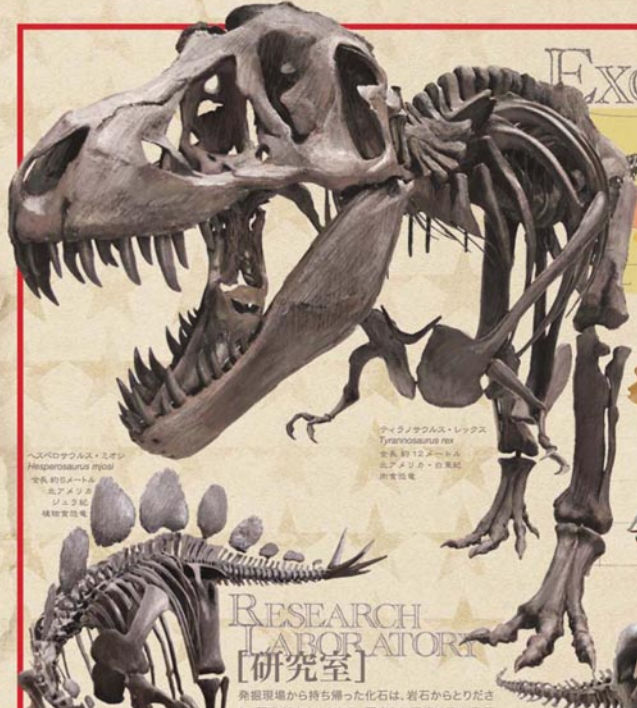
ティラノサウルス・レックス Tyrannosaurus rex 学名: 約12メートル ティラノサウルス 白垩紀 肉食恐竜