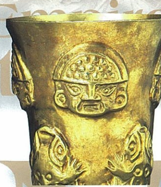
《シカン神の顔とヒキガエルを打ち出し細工した黄金のケロ》(部分)