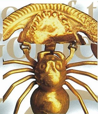
《高純度の黄金製の卵を抱いた蜘蛛》(部分)