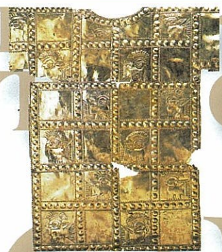
《黄金薄板製半袖チュニック》(部分)