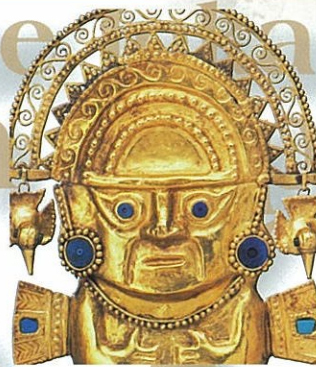
《黄金の儀式用トゥミ》(部分)