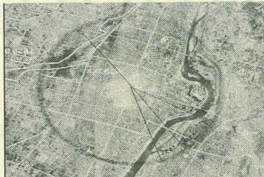
岡山地区のリト・モザイク(部分) 岡山空襲の際の爆撃中心点(現 NIT クレドビルあたり) が示され、全機がここを目標として焼夷弾を投下しました。