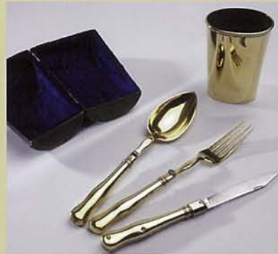
【マリー・アントワネットの金製旅行用カトラリー】 シュタルペンベルク侯爵家コレクション