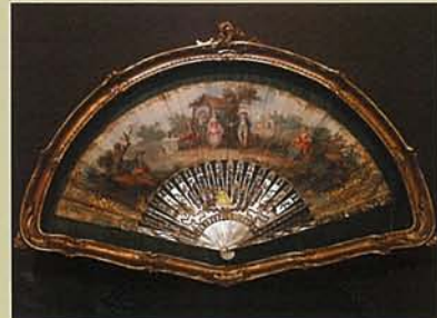
【マリア・テレジアの扇】 シュテファン大聖堂博物館蔵