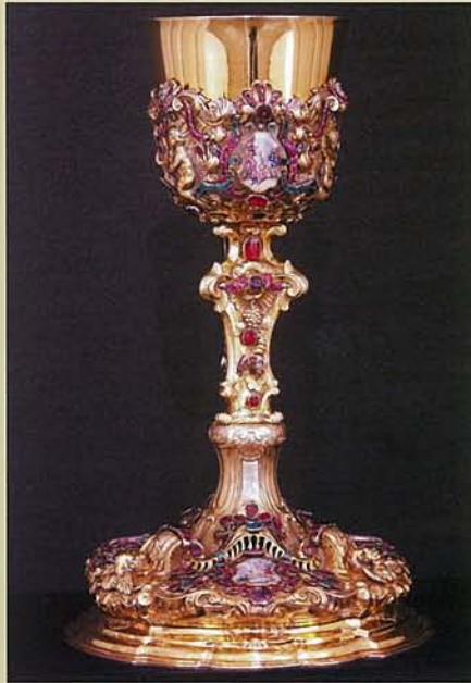
【聖杯】 シュテファン大聖堂博物館蔵