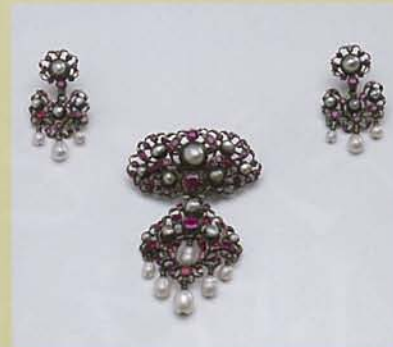
【マリア・テレジアがモーツァルトの姉ナンネルに贈った宝石】 ザルツブルク・カロリーネ・アウグステウム美術館蔵