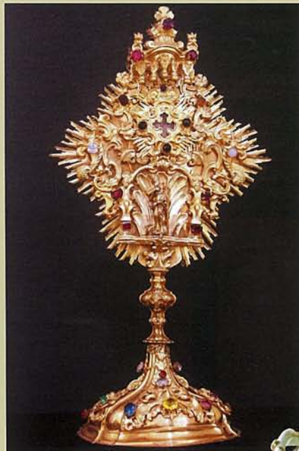
【聖パウロの聖遺骨入れ】 シュテファン大聖堂博物館蔵