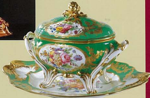
【青りんご色のスープ鉢】 王宮博物館蔵

岡山市デジタルミュージアムでは、開館1周年記念として『マリア・テレジアとマリー・アントワネット展 ～華麗なるハプスブルク家 母と娘の物語～』を開催します。オーストリアに650年にわたって君臨したハプスブルク家、その栄華の頂点18世紀に国母として親しまれた女帝マリア・テレジア。その娘でフランス王妃となり、フランス革命で悲劇的な最期を遂げたマリー・アントワネット。