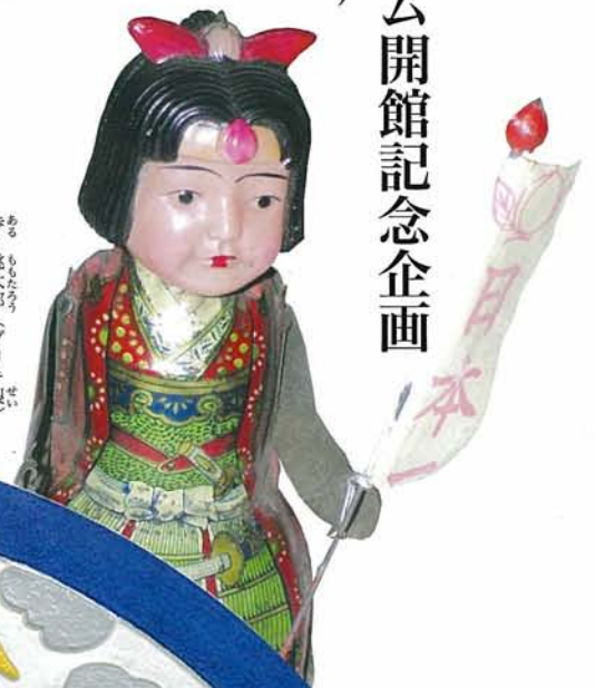
あるもたろ (フリキ せい) 歩く桃太郎 (フリキ せい) 兵庫県立歴史博物館蔵 (入江コレクション)