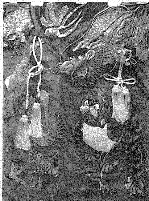
新収蔵品 ダンジリ緞帳(どんちょう)龍虎図 明治時代 北浦町内会寄贈