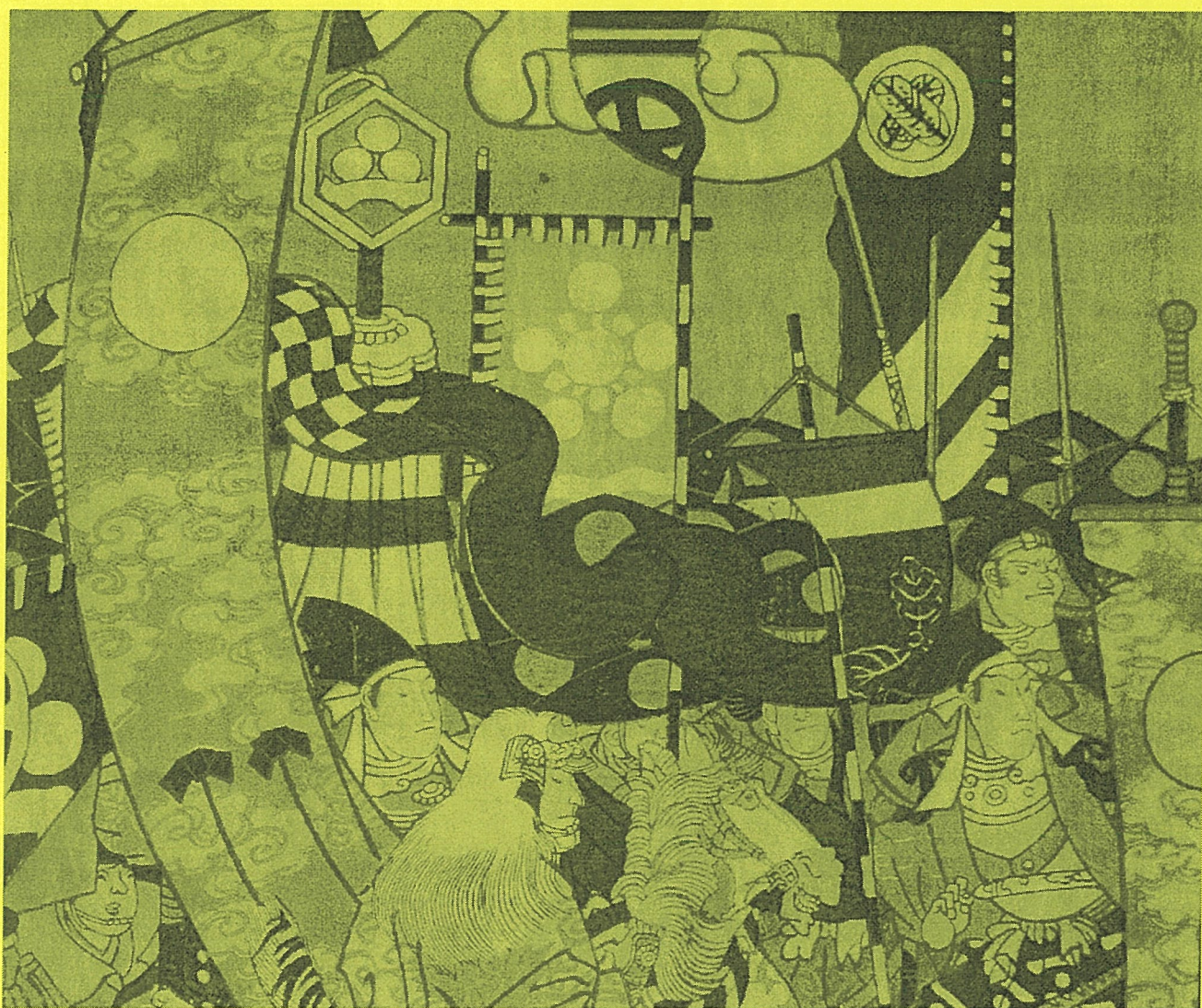
戊辰戦争をもとにした「山崎合戦官軍大勝利之図」(部分) 明治元年