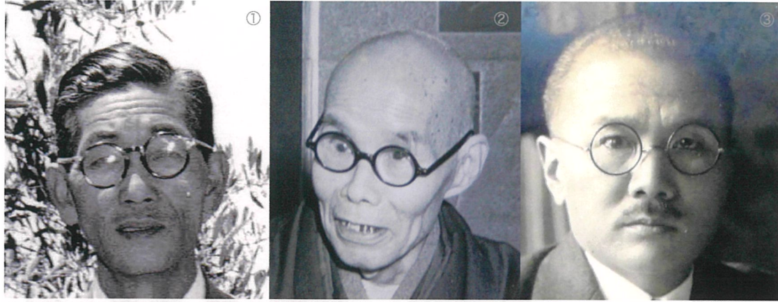
小企画コーナー 近代おかやまの基礎を築いた人々 2015