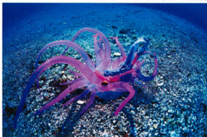
食う(スナインギンチャクの捕食) 小林 安雅