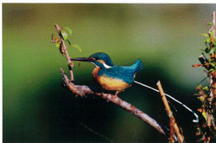
カワセムの排泄 和田 昌也