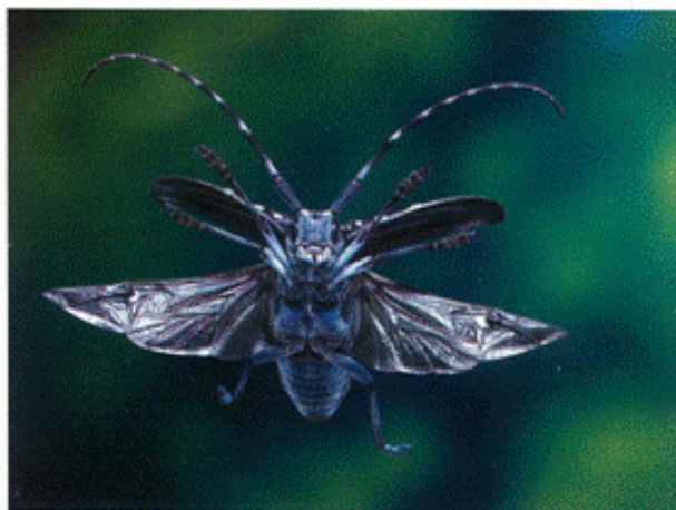
ゴマダラカミキリ 高嶋 清明