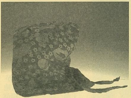
子供用の防空頭巾

太平洋戦争の末期、1945年(昭和20)は米軍による日本各地の都市市街地を対象とした空襲が本格的に行われた年でした。