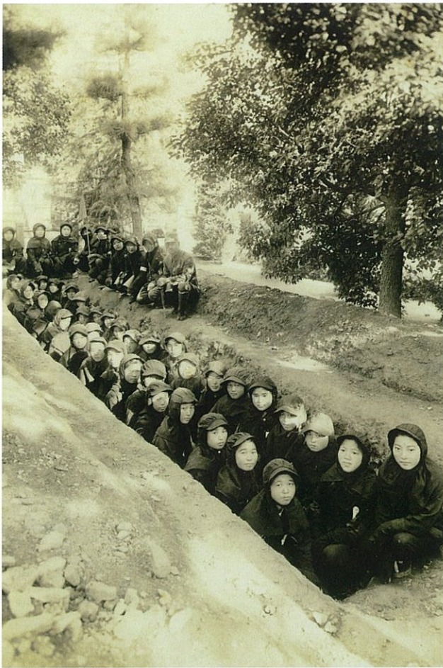
井原高等女学校の防空演習風景 昭和16～19年(1941～1944)