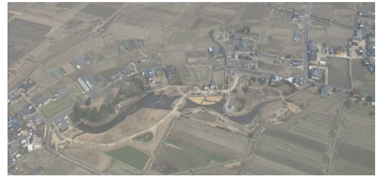
備中高松城址の空撮