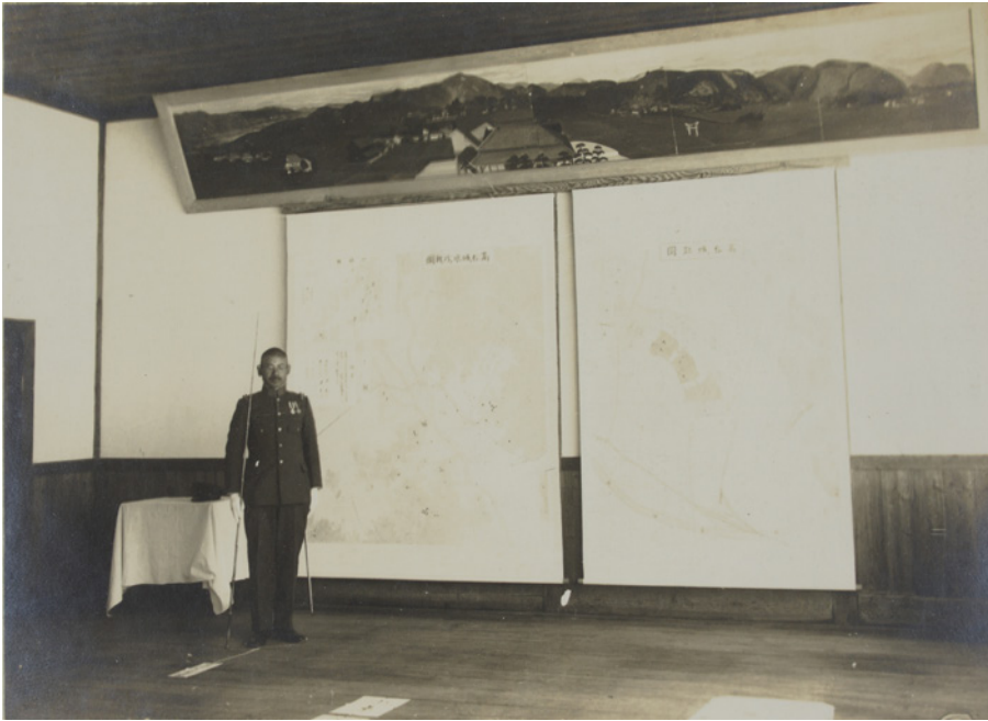
御前講演の高田馬治