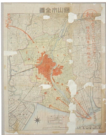
『焼夷弾爆撃二依ル焼失状況』