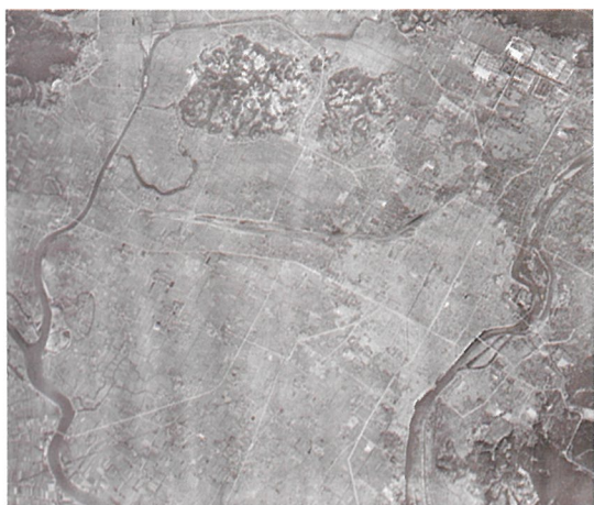
1945年7月5日に撮影された空襲後の岡山市

1944年から翌年にかけて、日本全土において市街地を対象とした大規模な空襲が米軍によって行われました。岡山市の場合は1945年6月29日に大規模な空襲を受け、当時の市街地の63%を焼失し、少なくとも1737人*の死者が出ました。（*2000人をこえるという説もあります。）