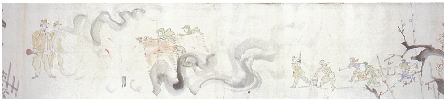
「銃後漫画通信」(画像は一部) 南義郎作 1942年