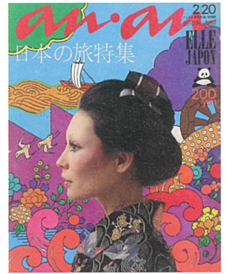
『an·an』第47号 1972年 平凡出版 アートディレクション: 堀内誠一 表紙イラストレーション: 原田治