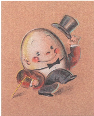
HUMPTY DUMPTY (OSAMU GOODS用原画) 1970年代後半~1980年代前半