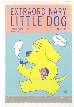
『EXTRAORDINARY LITTLE DOG』 作品集 1981年 PARCO出版