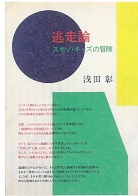
浅田彰『逃走論』 1984年 筑摩書房 装幀: 原田治