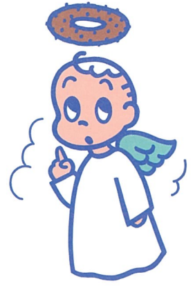
ミスタードーナツ キャンペーン用キャラクター 1986年