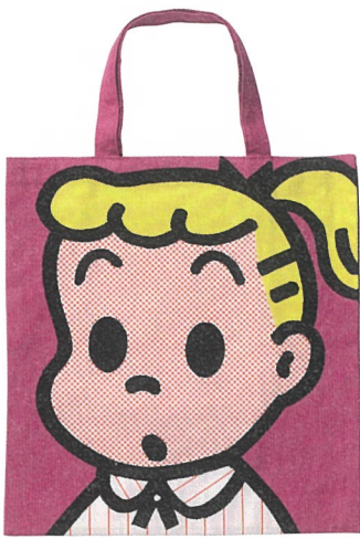
スクールバッグ(OSAMU GOODS®) 1992年 ©Osamu Harada / Koji Honpo