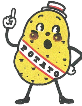
カルビー「ポテトチップス」など マスコットキャラクター 1976年 作: 原田治