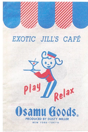
ショップバッグvol.47(OSAMU GOODS®) 1989年 ©Osamu Harada / Koji Honpo