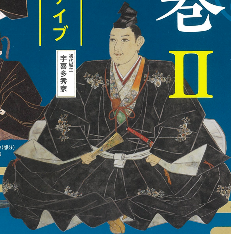
宇喜多秀家画像（部分） 岡山城蔵