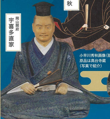
宇喜多直家像 岡山城蔵