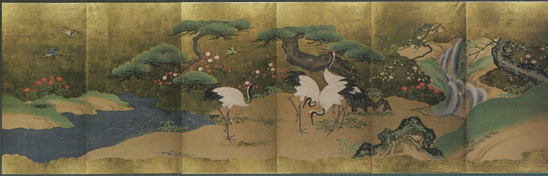
鶴図小屏風 岡山城蔵

岡山城天守閣が大規模な改修を迎えるのを機に、岡山シティミュージアムでは昨年度に岡山城収蔵品から優品を紹介する企画展を開催し、好評をいただきました。