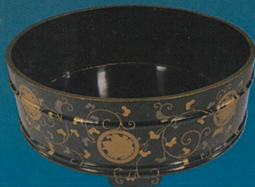
揚羽蝶紋金時絵道中盃 岡山城蔵