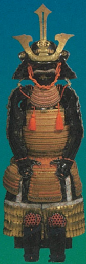
金小札緋緘袖付具足 玉井宮東照宮蔵

【日時】令和4年9月17日(土) 14:00~15:30 (13:30開場) 【会場】岡山シティミュージアム 4階講義室 【講師】当館映像ディレクター 米島 慎一 ※お申し込みの受付は9月2日(金) 10:00より開始します。