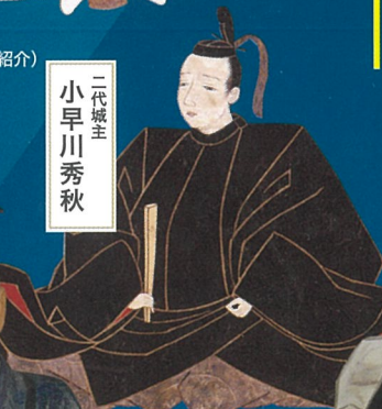
小早川秀秋画像（部分） 原品は高台寺蔵 （写真で紹介）