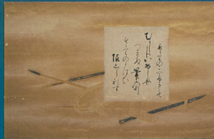
池田光政和歌 岡山城蔵