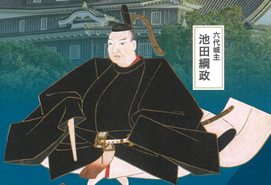
池田綱政画像（縄武像部分） 原品は林原美術館蔵（写真で紹介）