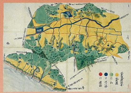
備中六条院西村絵図