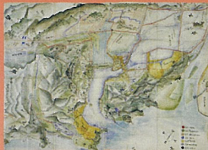
〔備中国玉島周辺絵図〕