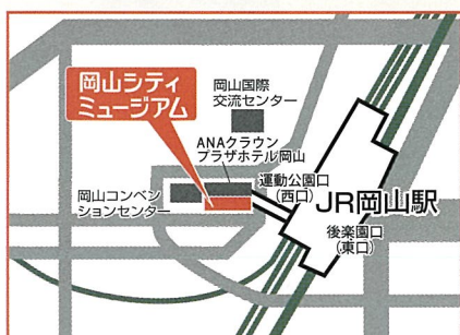
JR 岡山駅より東西連絡通路直結 徒歩2分