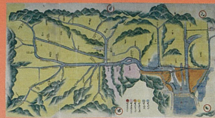
備中国阿賀崎村周辺絵図