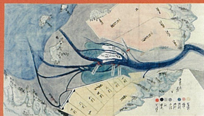
備前松山川流末連島・児島郡之間絵図