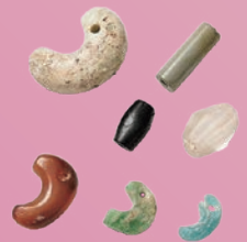
勾玉・管玉・切子玉・棗玉 / 塚段古墳