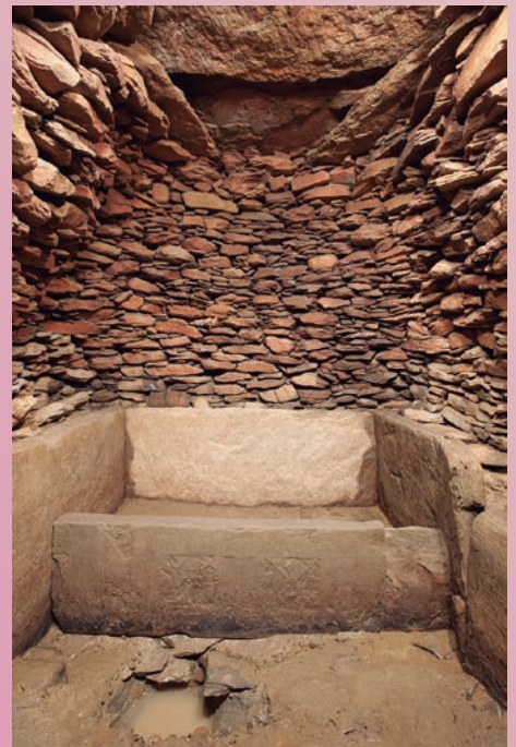
石室と仕切り石 / 千足古墳 (第五古墳)