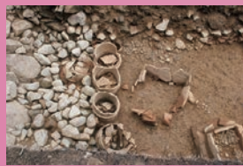
造り出しの様子 / 金蔵山古墳