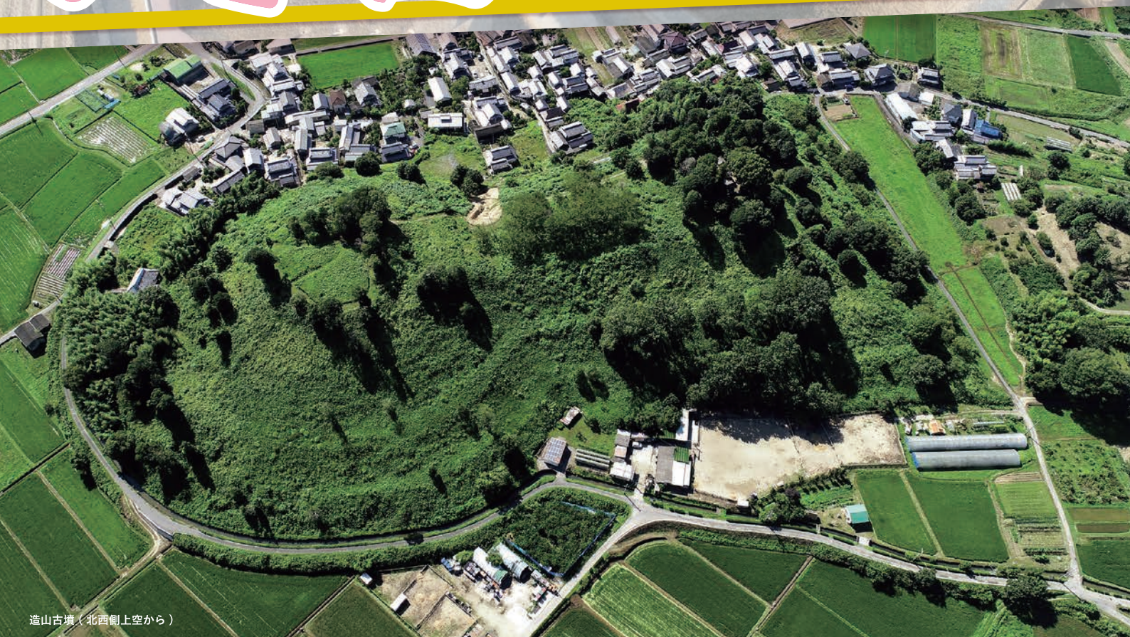
造山古墳(北西側上空から)