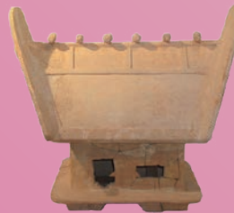
家形埴輪 / 第四古墳