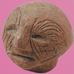
鯨面(入れ墨)土偶 / 津寺(加茂小)遺跡