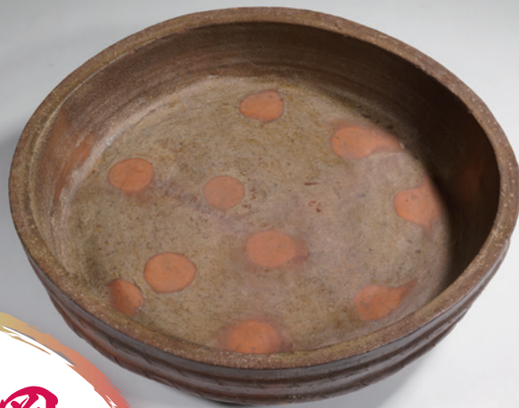
「馬盥四足大鉢」江戸前期 当館蔵