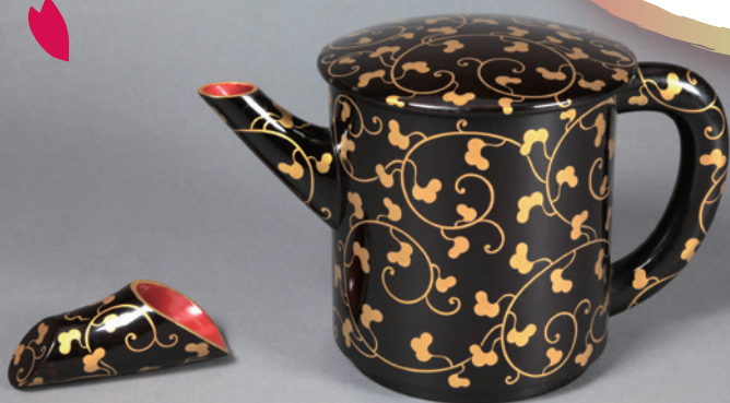
「散金唐草文湯桶」江戸時代 木下家資料 (当館寄託)