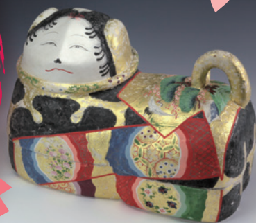
「御犬張子」江戸時代 木下家資料 (当館寄託)