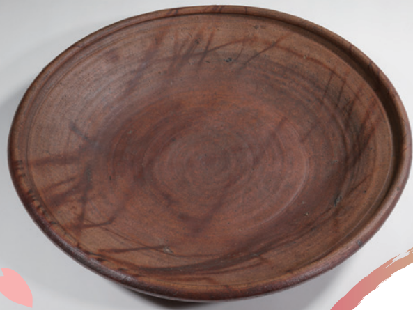
「火裸大皿」桃山期 当館蔵