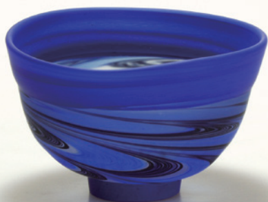
赤澤清和「茶盃」当館蔵