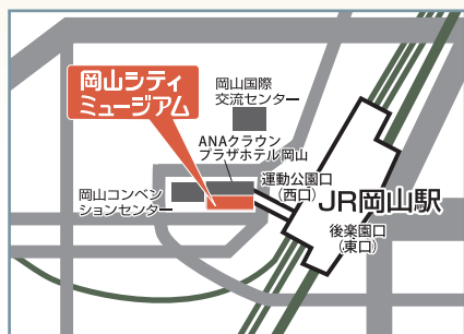
JR 岡山駅より東西連絡通路直結 徒歩2分