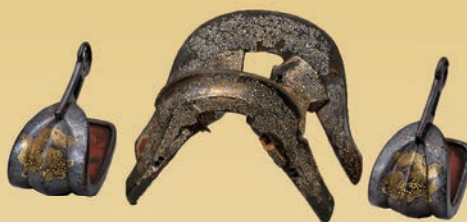
青貝泊蝶紋付鞍・獅子金象嵌鎧 池田輝政・利隆所用