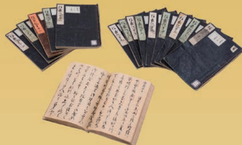
信長記（重要文化財）から一部