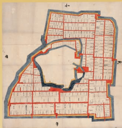
〔姫路城内家臣用屋敷割図〕