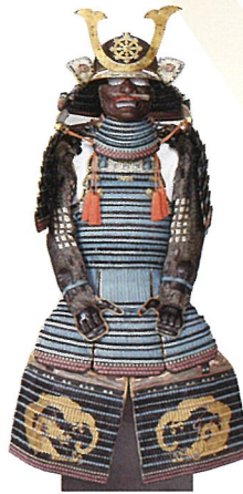
浅葱糸威本小札二枚胴具足 (木下家資料)