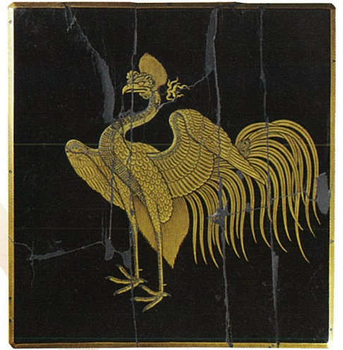
桐鳳凰時絵硯箱 (木下家資料)