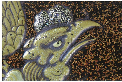
桐鳳凰時絵硯箱部分 (木下家資料)