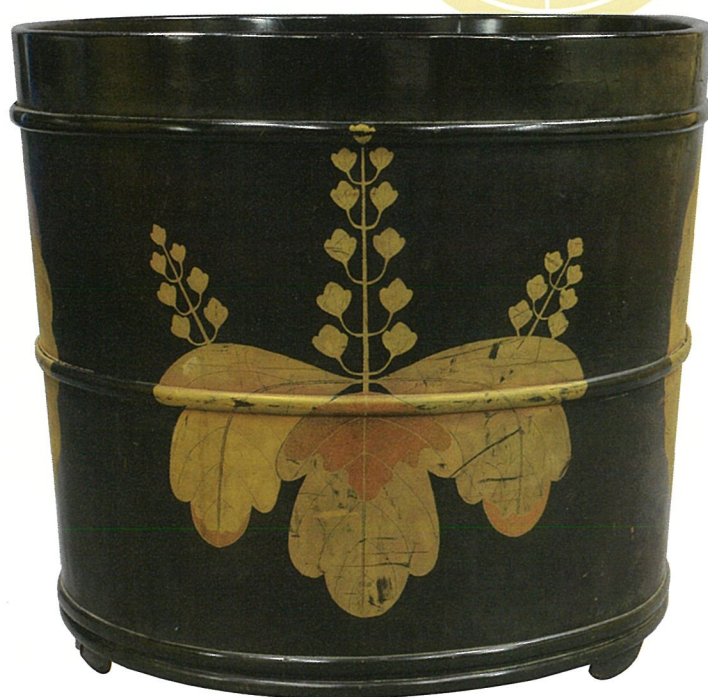
伝北政所所用 風呂桶 (木下家資料)