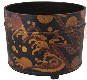
洗足桶 (木下家資料)