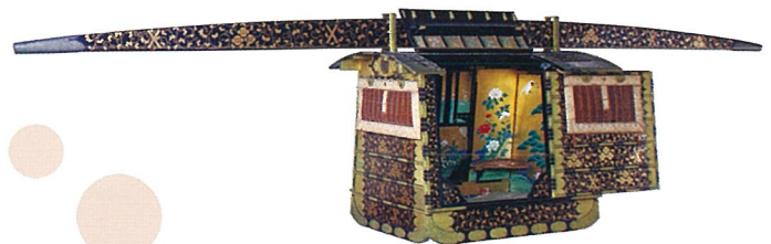
唐草遣棒紋時絵乗物 (木下家資料)