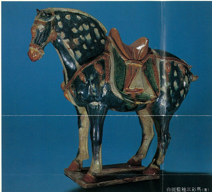
白斑藍釉三彩馬(唐)