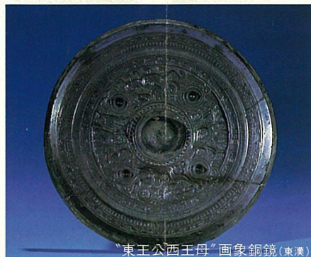
“東王公西王母”画象銅鏡(東漢)