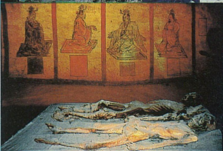
●アスターナより 出土した夫婦のミラの状態