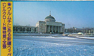
●ウルムチにある新疆ウイグル自治区博物館 シルクロード博物館全景