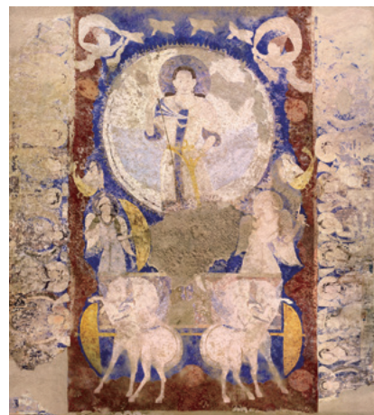
クローン文化財 パーミヤン東大仏天井壁画「天翔る太陽神」縮小版 320 × 270cm

クローン文化財は、熟練の技術による伝統的な模写・模造の技術とデジタル画像処理・印刷技術を融合させ、高精度かつ限りなく同素材同質感に近い複製を作り出す、東京藝術大学の特許技術です。本展では、2001年に失われたパーミヤン東大仏天井を飾った「天翔る太陽神」縮小版だけでなく、実際に触ることのできるパーミヤン壁画断片も特別展示します。