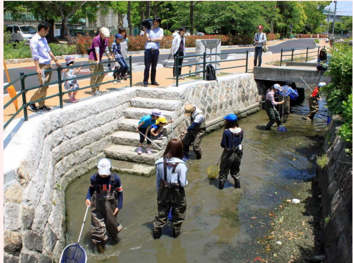
用水の環境点検活動