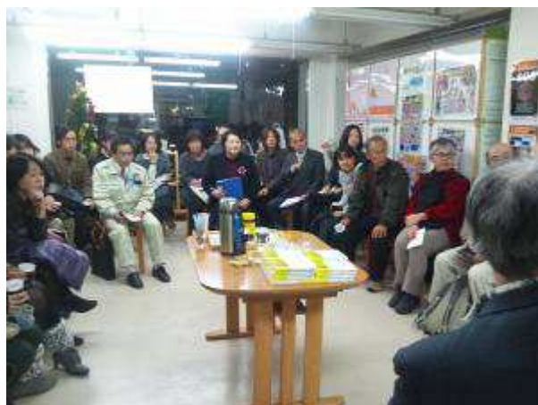
< ESD カフェ >