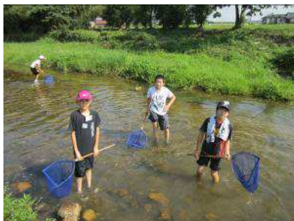
<仙台・岡山 ESD 子ども交流事業>