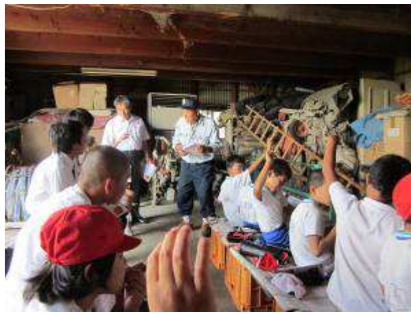
<第二藤田小学校 地元農家へ訪問>