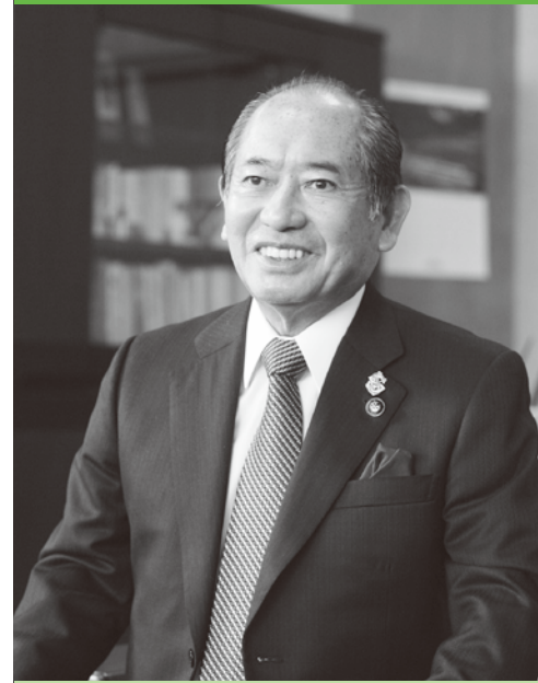
岡山市長 高谷 茂男