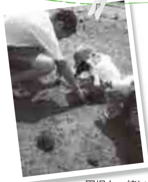
園児と一緒に 清掃活動に取り組む