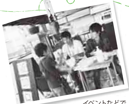
イベントなどで リユースの食器を使うことにより ゴミを減らす「エコスマ」の活動

すでに岡山市では、多くの方がESDに取り組んでいます。 学校やイベントなどを通じてあなたも何らかの形でESDに関わっているかもしれません。 このコーナーでは、現在実践している団体の活動を紹介します。