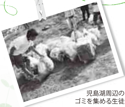
児島湖周辺の ゴミを集める生徒