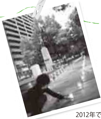
2012年で 8回目を数える 「西川キャンドルナイト」の活動