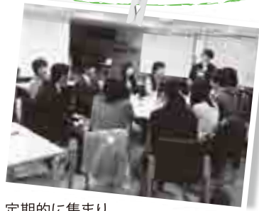
定期的に集まり、次回行う「だっぴ50×50」の案を練る実行委員のメンバー