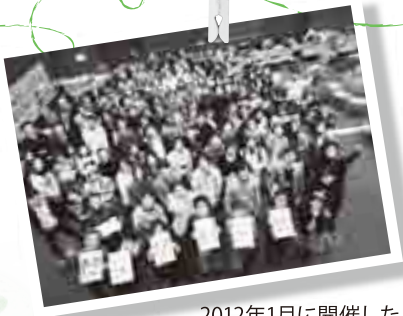
2012年1月に開催した「だっぴ50×50～2012～」の全参加者