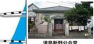
津島新野公家堂 (旧騎兵第21聯隊将校集会所)