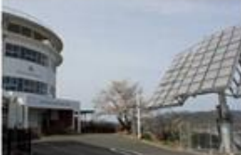
京山ソーラーグリーンパーク