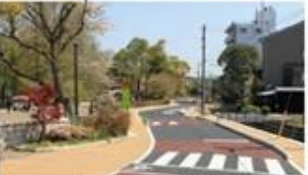
観音寺用水「緑と水の道」