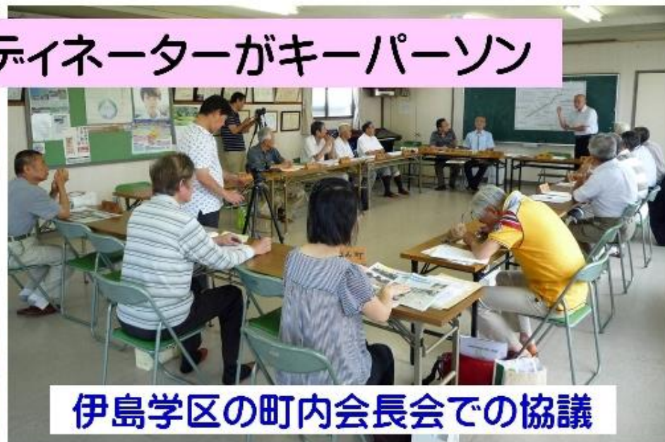
伊島学区の町内会長会での協議