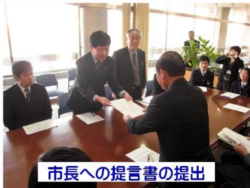
市長への提言書の提出