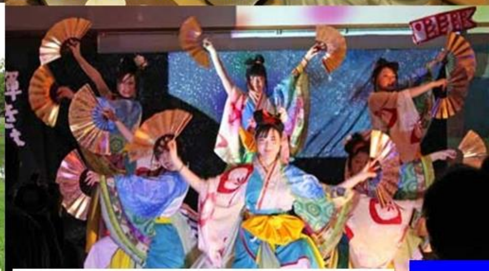
ESD劇の制作 (劇団公民館・京山)