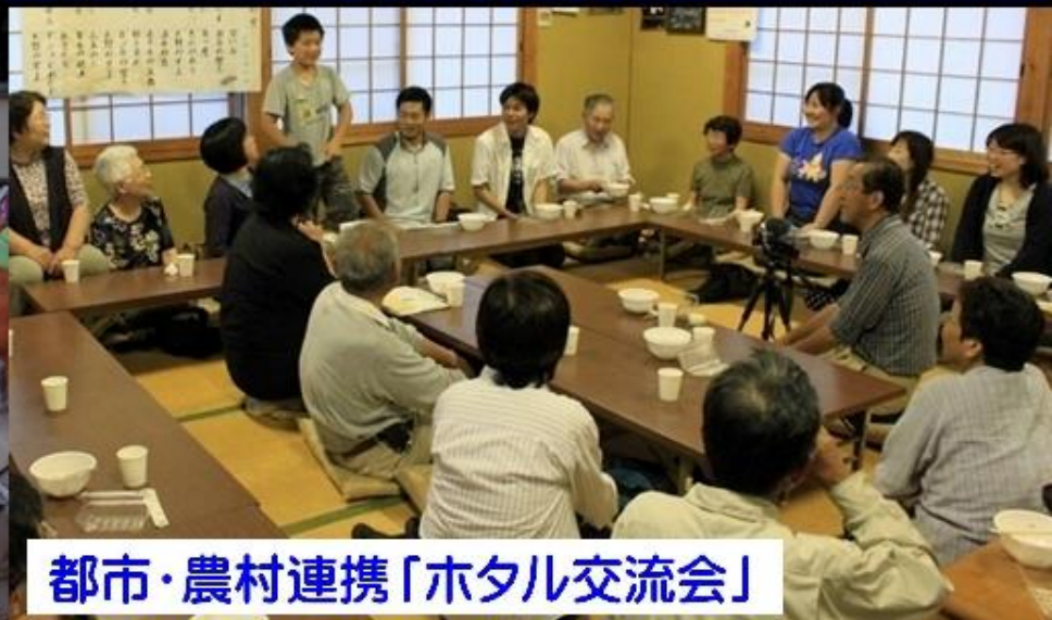
都市・農村連携「ホタル交流会」