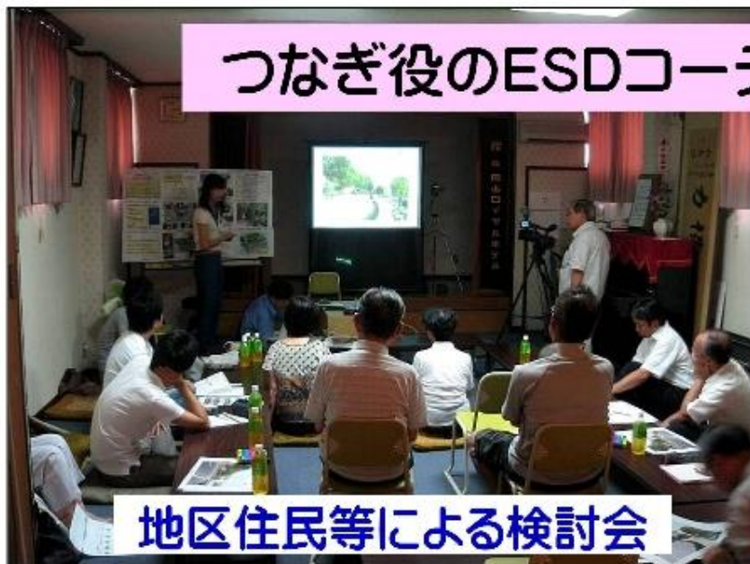
地区住民等による検討会