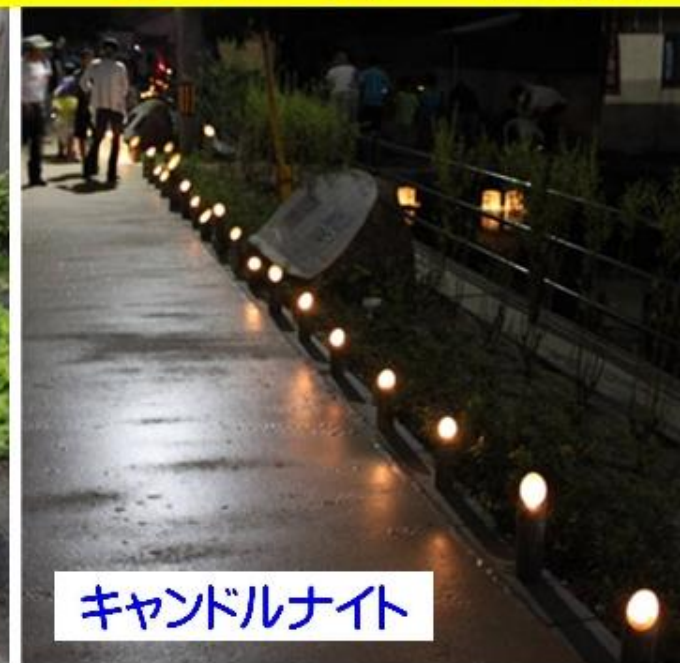
キャンドルナイト