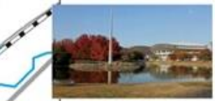
岡山県総合グラウンド