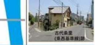
古代桑里 (東西基準線)跡