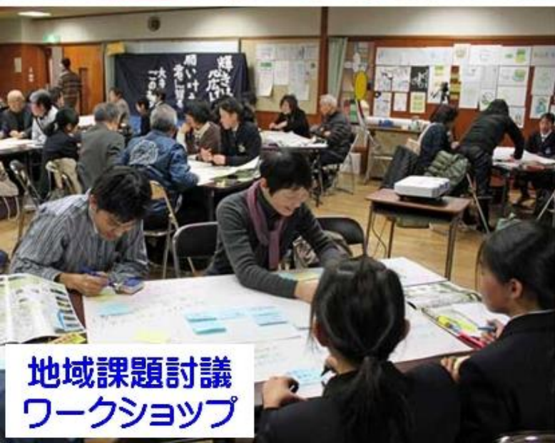
地域課題討議 ワークショップ