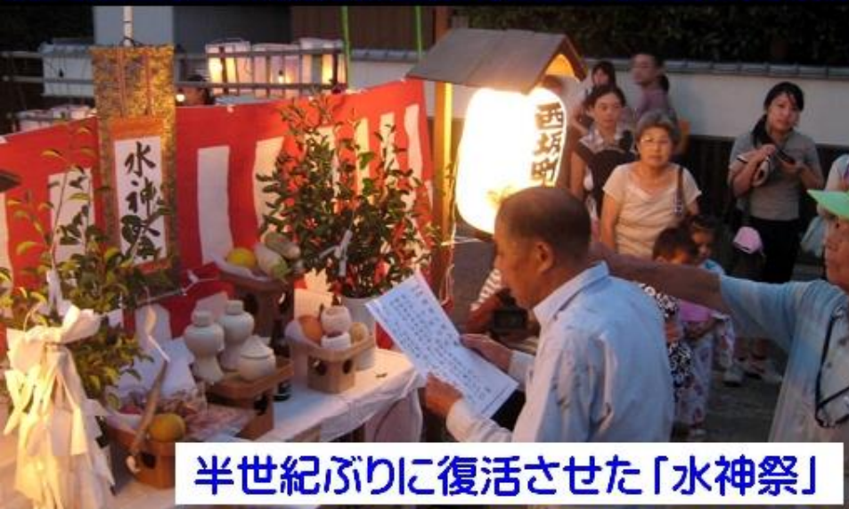
半世紀ぶりに復活させた「水神祭」