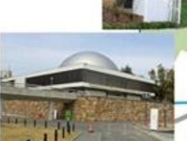
人と科学の未来館「サイビア」