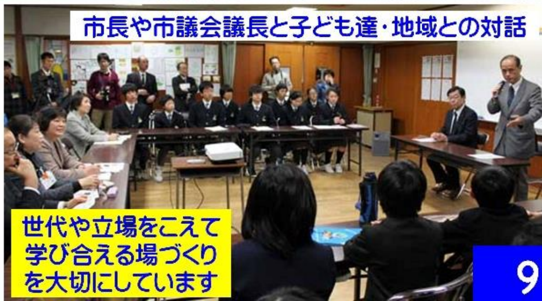
市長や市議会議員と子ども達・地域との対話