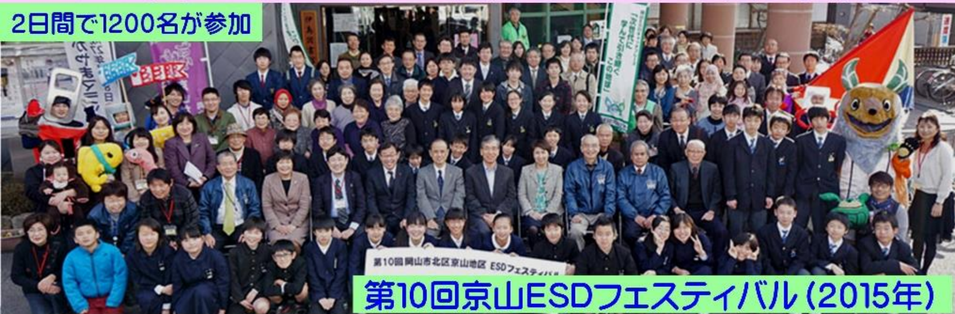
第10回京山ESDフェスティバル(2015年)