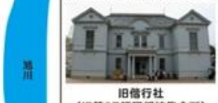
旧徳行社 (旧第17師団将校集会所)