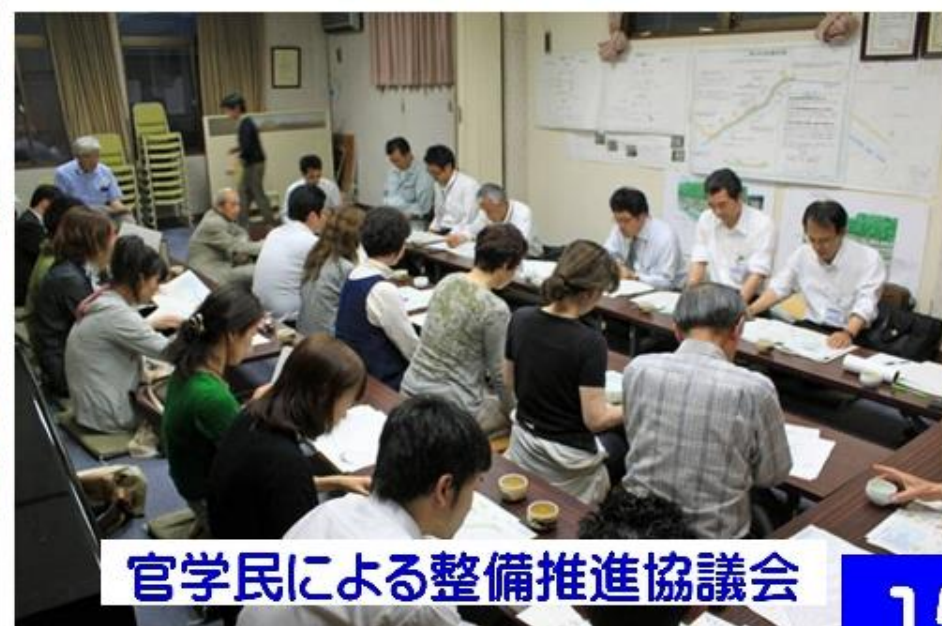
官学民による整備推進協議会