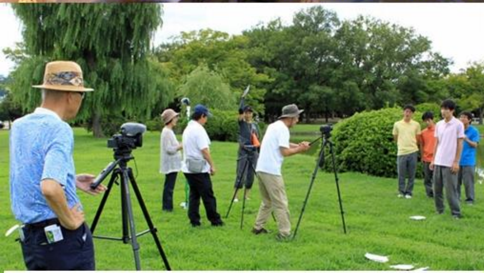
ESD映画の制作 (ムービー京山、京山ICT)