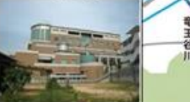
北ふれあいセンター