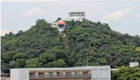
京山地区のシンボル「京山」