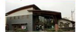
京山地区のESD拠点 岡山市立京山公民館