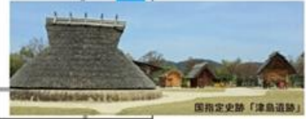
国指定史跡「津島遺跡」