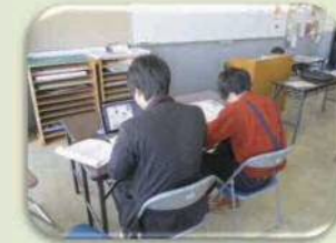
ゼミの入力中です