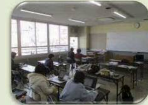
授業の一コマです