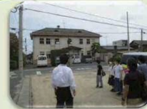
公共施設の見学に行きました