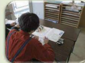
制作の一コマです