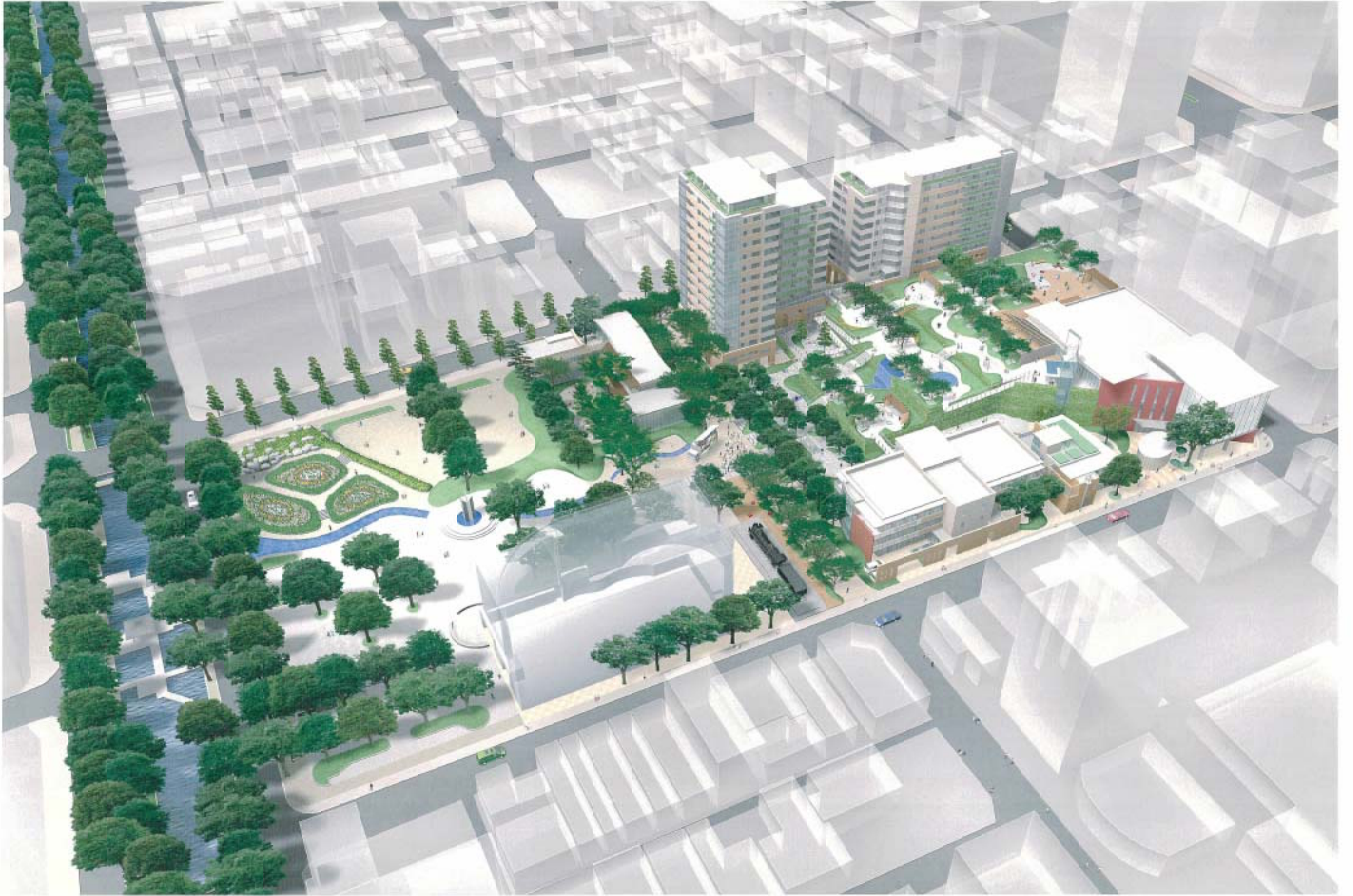
OKAYAMA Inter.PARKS 全景