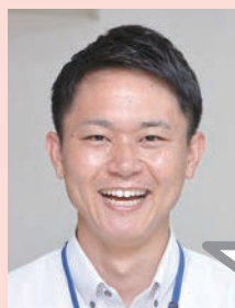
旭竜小学校 村瀬教諭

第2子が生まれた時に 出産補助休暇 を取得しました。上の子の世話をしたり、大事な時に家族のそばにいられたのでいい思い出になりました。今後は 子育て休暇 も取得して、また家族で新たな思い出を作りたいですね！