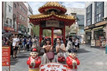
友人と神戸の中華街へ