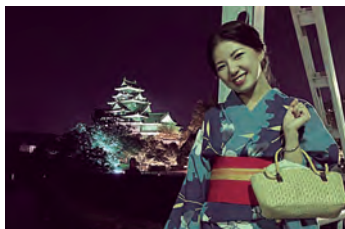
浴衣着ちゃいました