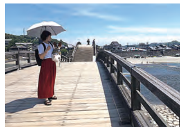
【右】 愛犬と一緒に錦帯橋へ。 どこへ行くのも一緒です！