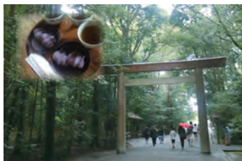
念願の伊勢神宮と赤福