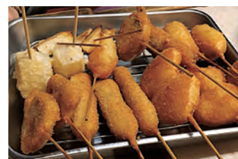
串カツをもう一度