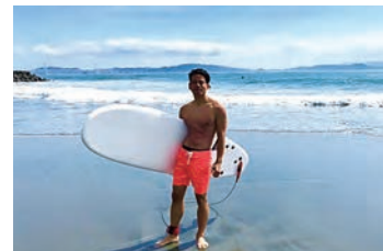
サーフィン、はまっています

夏休みは沖縄でスキューバダイビングしてきました！同じ職場の先輩に穴場のお店とスポットを教えてもらって。また新しい趣味が増えそうです。