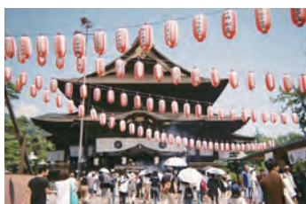
最強のパワースポット善光寺