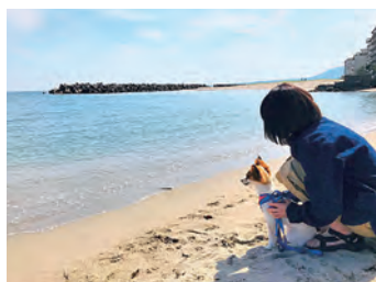
【左】 愛犬と一緒に浜辺を散歩。 風が気持ちよかったです。