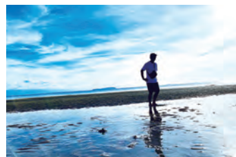
日本のウユニ塩湖

旅行も好きで、夏休み中には、日帰りですが香川県の父母ヶ浜に行きました。休みが数日とまって取れば、大阪とか行きたいですね。お好み焼き、たこ焼き、串カツ・・・。