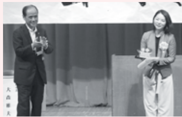
(写真の受影者は代理)

両備ホールディングス株式会社は、多岐にわたる事業を展開する両備グループ全体でダイバーシティ・マネジメントを進めるため、グループ内の異なる会社・部署に所属するメンバーで