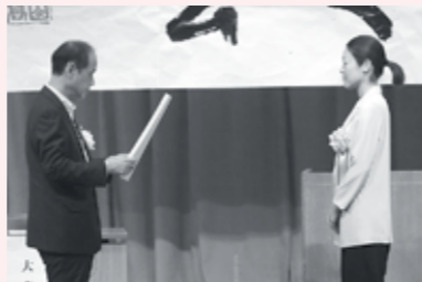
(写真の受影者は代理)

こうした活動について、女性の希望に応じた働き方への積極的な支援を行い、社会における女性労働者の能力発揮を促進しているものとして高く評価いたしました。