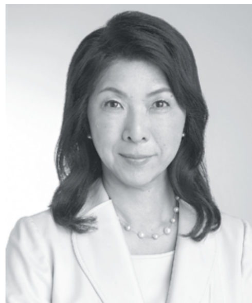
1956年 福岡市生まれ。1979年 労働省（現厚生労働省）入省。以後男女雇用機会均等法、育児休業法等の立案をはじめ女性労働、職業安定、労働基準等の行政に従事。厚生労働省雇用均等・児童家庭局長などを経て、2018年6月から（公財）21世紀職業財団会長、日本電気株式会社社外取締役、新日鐵住金株式会社社外取締役を務める。

自分の仕事にやりがいを感じて前向きに取り組み、成果を出している女性に出会うと本当にうれしくなります。そういう女性は確かに輝いて見えます。よい評価を得て、より高いポジションを与えられると、その輝きは一段と増すかもしれません。職業生活だけでなく私生活の充実も実現していれば、なおのことでしょう。できるだけ多くの働く女性にそのようになっていただくためにはどうしたらよいのでしょうか。公益財団法人21世紀職業財団は、男女雇用機会均等法が施行された1986年に、企業の雇用管理に均等法の趣旨を定着させることを目的として発足しました。現在、当財団が実施している諸事業もまさに「女性が輝き活躍する」ことを目指すものですが、今回はさらに幅広い観点から考えてみます。