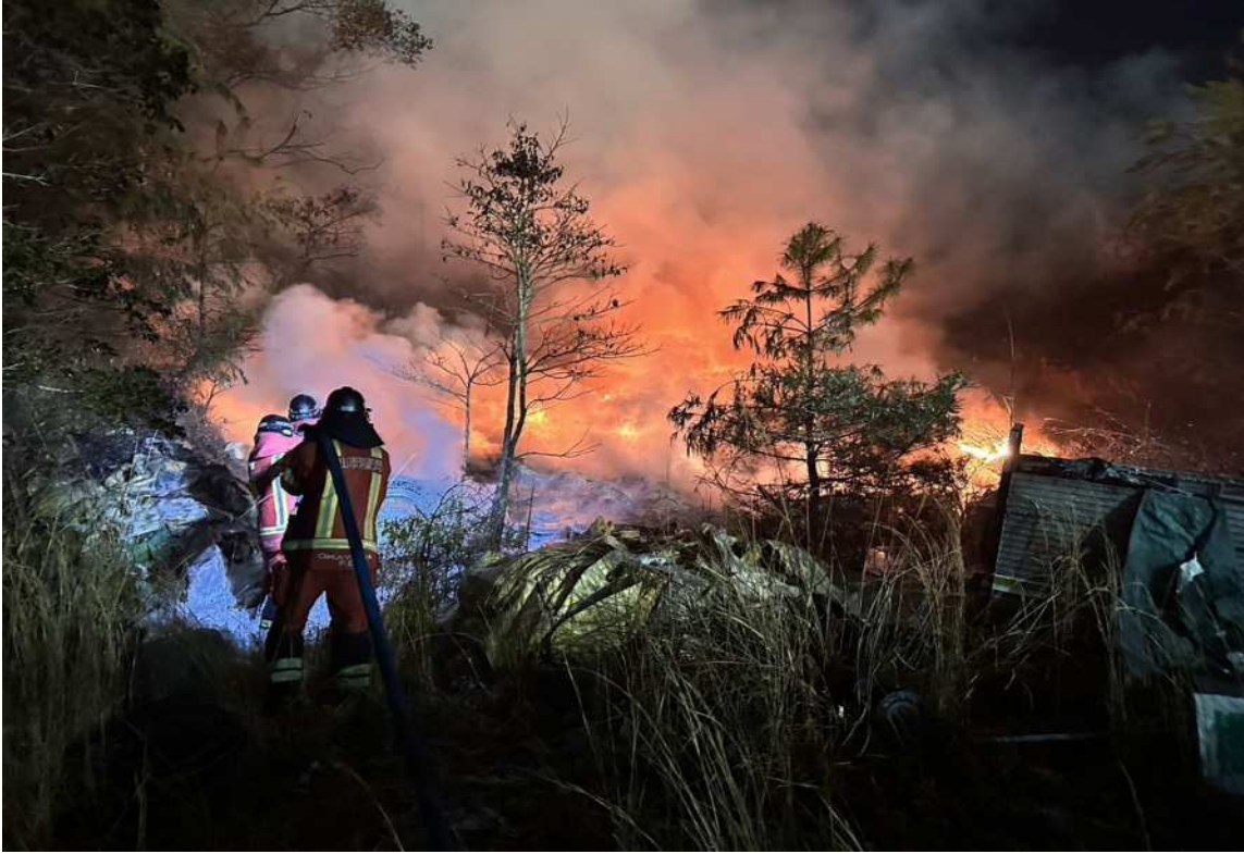
南区飽浦地内林野火災における現場活動の様子