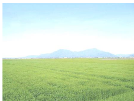
写真：灘崎地区の広大な農地