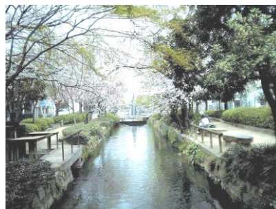
写真：西川緑道公園