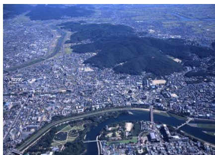
写真：市街地を縁取る里山