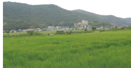
写真：龍ノ口山（近郊五山）