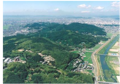
写真：市街地を取り囲む緑

※おかやまガーデンリングについては「2-1. 基盤となる緑をまもる（緑の保全）」の項を参照。