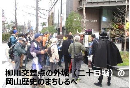
柳川交差点の外堀(二十日堀)の岡山歴史のまちしるべ

「旭公民館だより」は町内会長様方のご厚意により配布(回覧)していただいております。この場をお借りして御礼申し上げます。 ●次号は、令和7年7月1日発行の予定です。