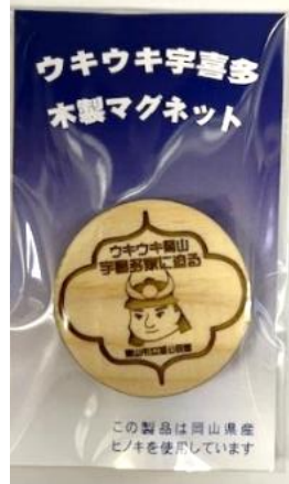
オリジナルの参加記念品