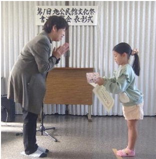
公民館書道展覧会の表彰式

11月23日(土)24日(日)、第25回文化祭を開催しました。展示発表、実技発表、喫茶やうどんコーナー、また高校生ボランティア「ハイスクール」のクラフトコーナーなど、たくさんの方に楽しんでいただきました。参加、ご協力いただいたクラブの皆様をはじめ、ご支援いただいた団体の皆様、ありがとうございました！