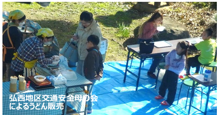
弘西地区交通安全母の会によるうどん販売

「旭公民館だより」は町内会長様方のご厚意により配布(回覧)していただいております。この場をお借りして御礼申し上げます。 ●次号は、令和7年3月1日発行の予定です。