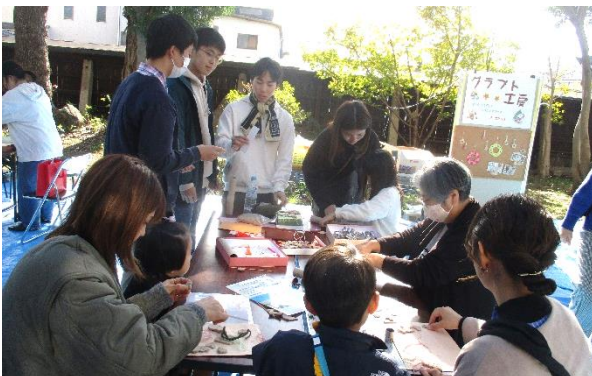
クラフトコーナーは大活躍！